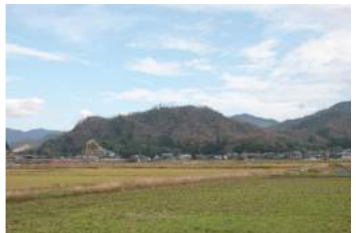
写真2 此隅山城の遠景