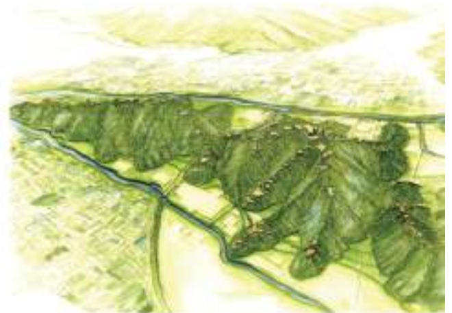
図1 此隅山城の復元イラスト