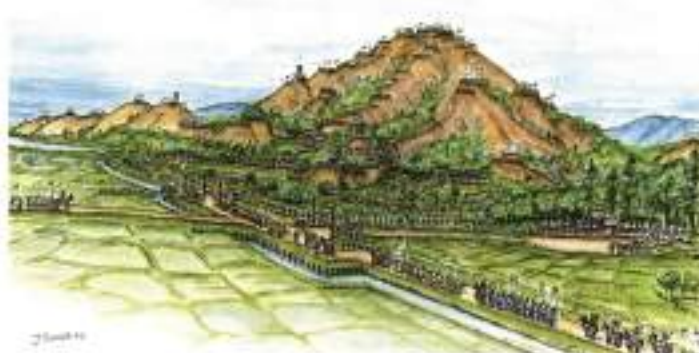
図2 山名氏守護所の復元イラスト