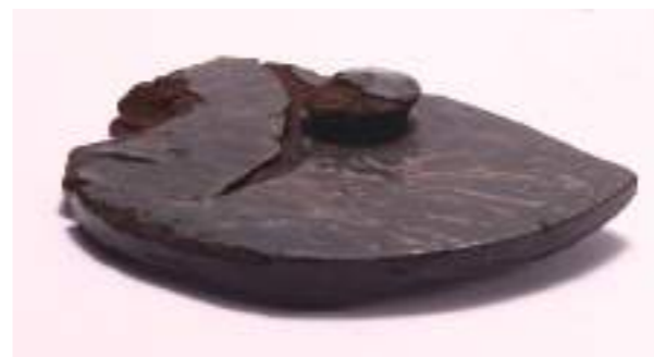
漆器の蓋（当時の高級食器）