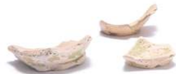
緑釉陶器（当時の高級食器）