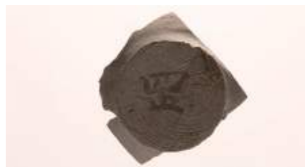
墨書土器（「疋」は「岡」の異体字）