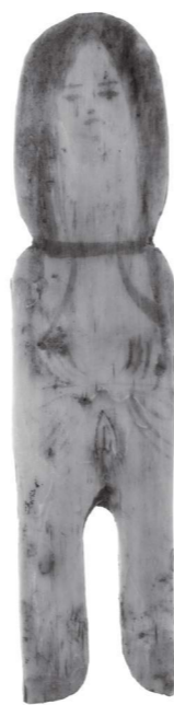
人形の赤外線写真