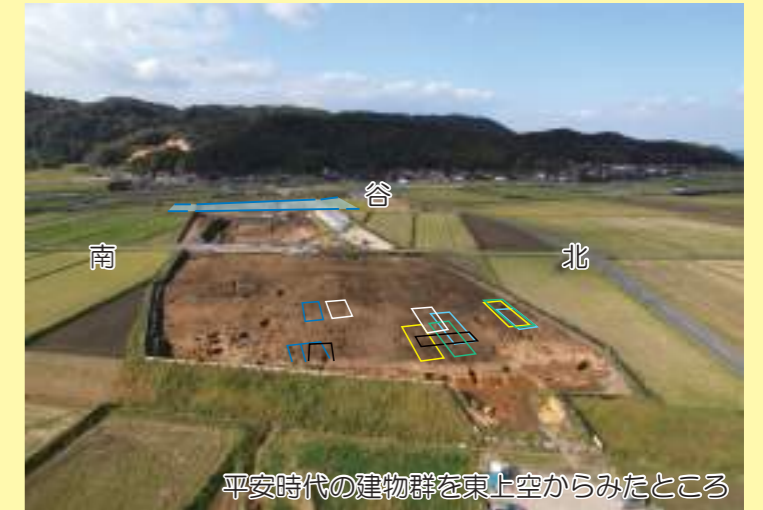
平安時代の建物群を東上空からみたところ

調査地の東側は南北に長い台地になっていて、その東端あたりで大きな掘立柱建物がたくさん見つかりました。