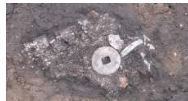
地鎮のために埋めた古代の銭貨