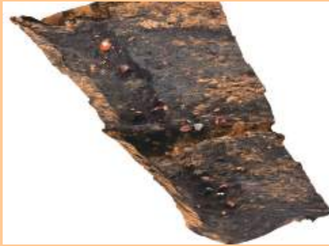
道路側溝から遺物が出土したようす (3D 画像)

台地の西の縁には、平安時代に造られた幅2m前後の道路が見つかりました。青谷横木遺跡などで見つかった古代山陰道と比べて幅が狭く、おそらく逢坂谷の中を南北に延びる道と思われます。道路はもともとあった地面の上に基盤のロームを盛って強く叩き締めて造られており、くりかえし造り替えが行われていました。