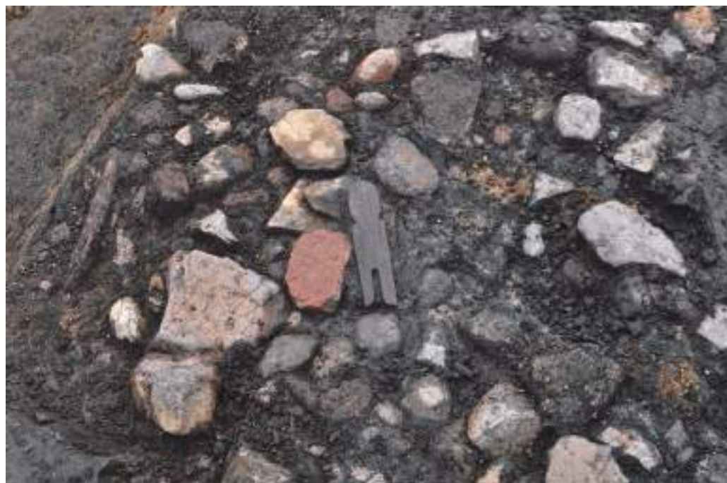
女性人形が出土したようす（裏返った状態で出土しました。）

この人形は水に流すのではなく、石敷きの上で祭祀などの行為を行う前に場を清めるために使われたのかもしれませんが。