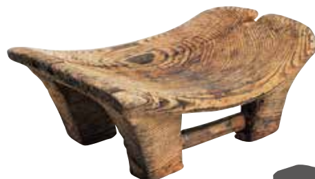
鳥取市 乙亥正屋敷廻遺跡出土の腰掛