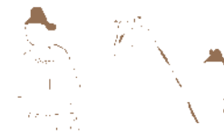
鳥取市青谷横木遺跡出土の板絵