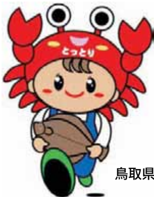
鳥取県のマスコットキャラクター「ととリン」

そのために、この本を学習に役立てていただくとともに、家の人と鳥取県の農林水産業について話し合うきっかけにさせていただきたいと願っています。