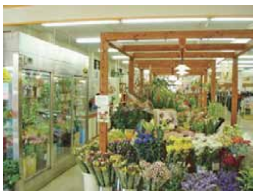
町にある花屋さん

花をかざることで心にゆとりやゆたかさが生まれます。鳥取市の 一家庭あたりの花を買う金額は全国でも6位と上位にあるので、鳥 取県民は花が好きであることがわかります。