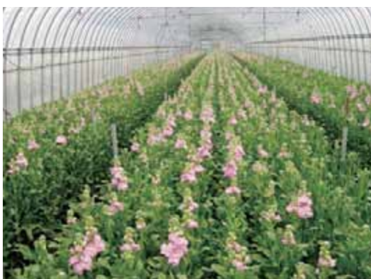
北栄町のストック