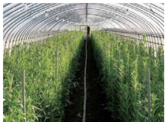
北栄町のシンテッポウユリ (ハウスさいばい)