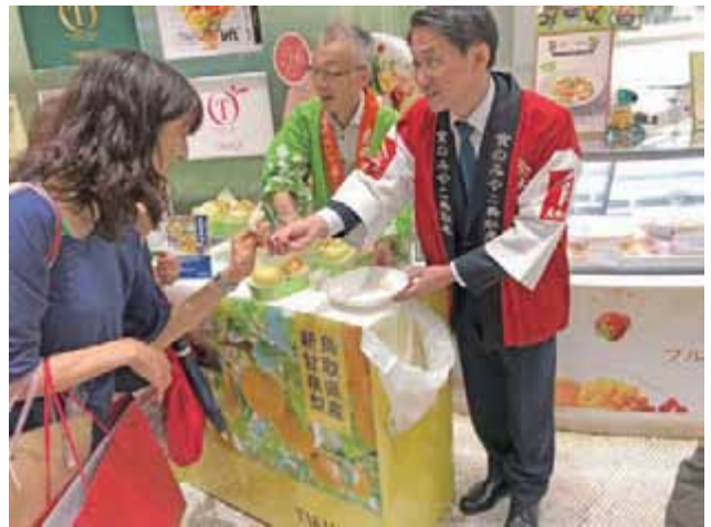
デパートなどでの梨のPRの様子 ようす

鳥取県では、東京や大阪、名古屋など大都市圏のデパートやスーパーなどで、「鳥取すいか」や「なし」 まつば 、「松葉がに」 わ 、「鳥取和牛」 ぎゅう など、県内の農林水産物の旬の時期にあわせて、フェアなどを開催し、旬の食材の魅力 しみりよく を消費者の皆様にPRしています。