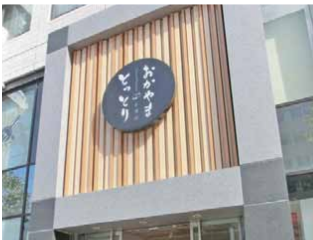
東京にある鳥取・岡山両県の特産品がそろう「とっとり・おかやま新橋館」 とっとり とくさんひん

こうした取り組みを通じて、鳥取ならではの旬のおいしい農林水産物を全国へ向けお届けしています。