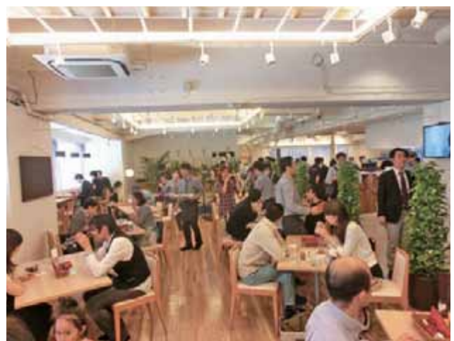
「とっとり・おかやま新橋館」2階レストランでは鳥取の食材を使ったメニューが食べられる とっとり