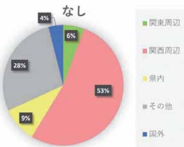
県産なしの出荷先 (%)