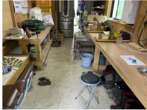
現状の作業場(内観)