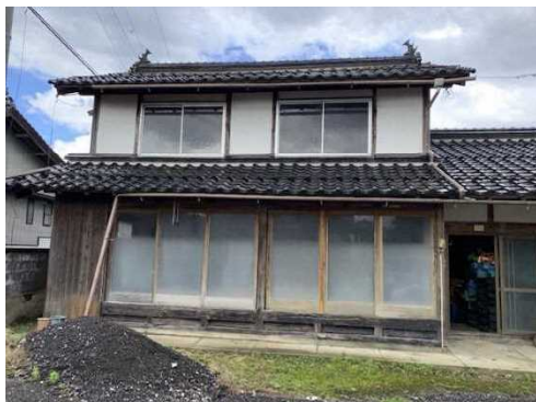
改修予定の空き家(外観)

また改修予定の作業場は面積が 88 m 2 あり、根葉切り・皮剥ぎ・結束・箱詰めまでの一連の作業動線を確保できる【資料 2】、また収穫して出荷調整前のねぎを置いておくスペースもあり、天候による作業の遅れを最小限に抑えることもできるため、現状より作業効率を格段に高めることができ、白ネギ調整機の導入と併せることで作業負担の軽減も図られ、今後の規模拡大に対応できる。