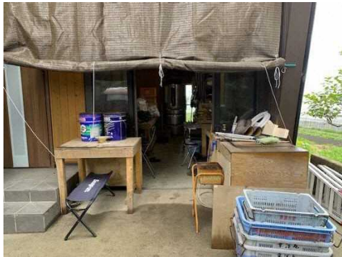
現状の作業場(外観)

また、根葉切りは手作業で行い、皮むき機は中古の旧式のため、1時間あたり多くて10ケースしか処理できず、現状の作業場の状況と併せると50ケース/日の処理能力しかない。