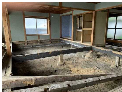
改修予定の空き家(内観)