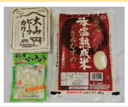
県産米やレトルト食品等のコース