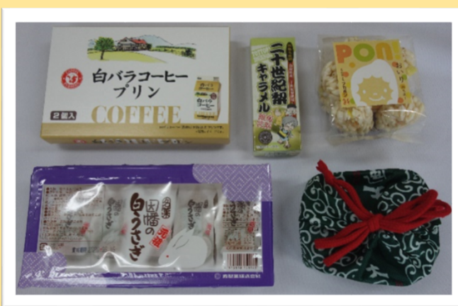
鳥取の銘菓コース