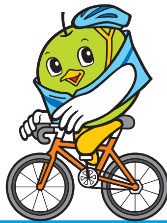
サイクリングトリピー