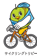
サイクリングトリビー