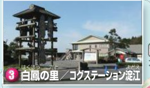
3 白鳳の里 コグステーション 滝江