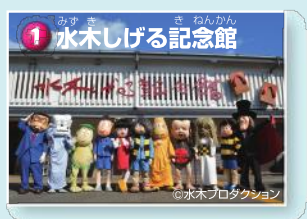
1 水木しげる記念館