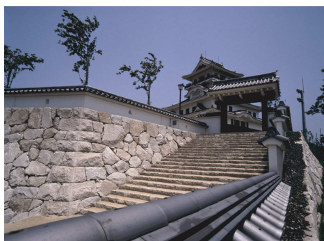
お城山展望台（河原城）