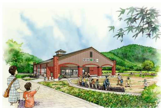
ミニ SL 博物館