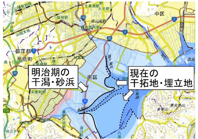
図3 岡山市南部の干拓地・埋立地と明治期の干潟・砂浜の分布 (それぞれの輪郭の一部を点線と実線で示している) 国土地理院の標準地図に「明治期の低湿地」を重ねて表示。