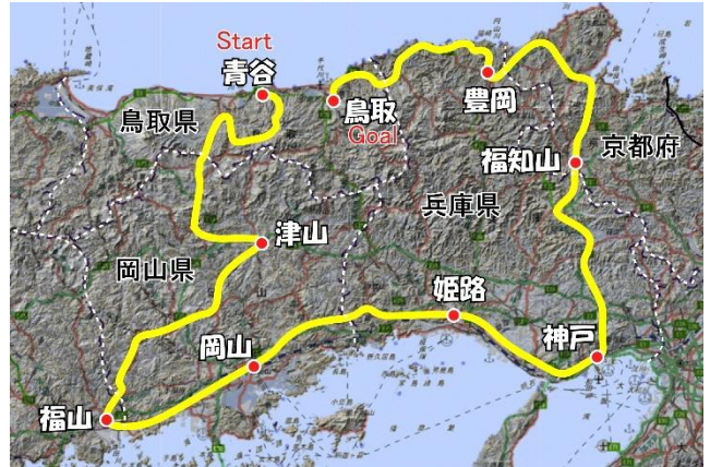
図2 『十一国無銭旅行記』から推定される旅行ルート 国土地理院の標準地図と陰影起伏図を重ねた地図にルート、地名、県境を加筆。

【引用文献】徳田貞一（1936）『十一国無銭旅行記』古今書院 ※「国立国会図書館デジタルコレクション」で閲覧できます。 赤木一郎（2006）『独創的な実験で日本列島の雁行構造を説明した徳田貞一』地球科学 60 巻, p.339～343