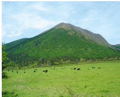
西の原（放牧）と男三瓶