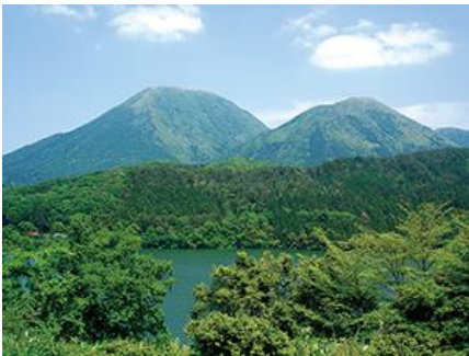
男三瓶・子三瓶と浮布池

この地域は、「島根県立三瓶自然館サヒメル」や「国立三瓶青少年交流の家」、「山の駅さんべ」など複数の活動拠点と多様な自然環境を有しており、登山、ハイキング、キャンプ、ピクニック、クロスカントリー、ツーリング、自然学習など、四季を通じた幅広い利用が行われている。また、三瓶温泉や湯抱温泉は古くから情緒ある保養地となっている。この地域の近隣にある、約 4,000 年前の三瓶山の噴火により埋没した巨木群は、「三瓶小豆原埋没林」として国の天然記念物に指定され、世界遺産石見銀山遺跡をはじめとする三瓶山・大江高山の火山活動に由来する周辺の文化財とともに、日本遺産「石見の火山が伝える悠久の歴史～“縄文の森”“銀（しろがね）の山”と出逢える旅へ～」に認定されている。