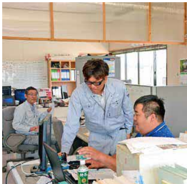
働きやすい職場を全員でつくっているみたこ土建