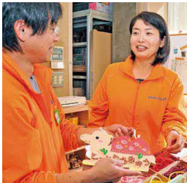
育児中の職員にも働きやすい職場を目指す鳥取砂丘こどもの国