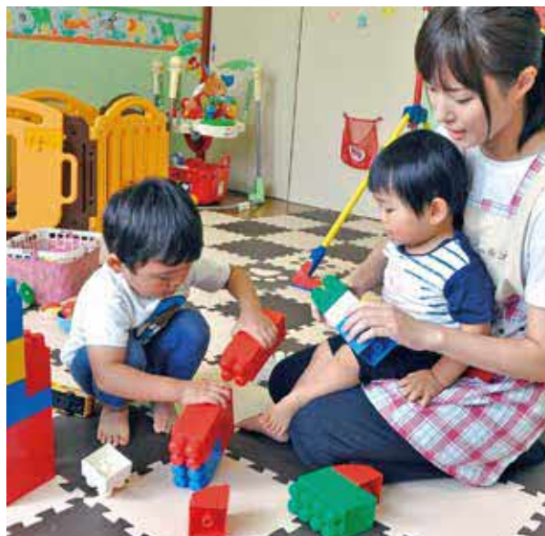
職員の仕事と家庭の両立を支える事業所内保育所「すくすくよじが」