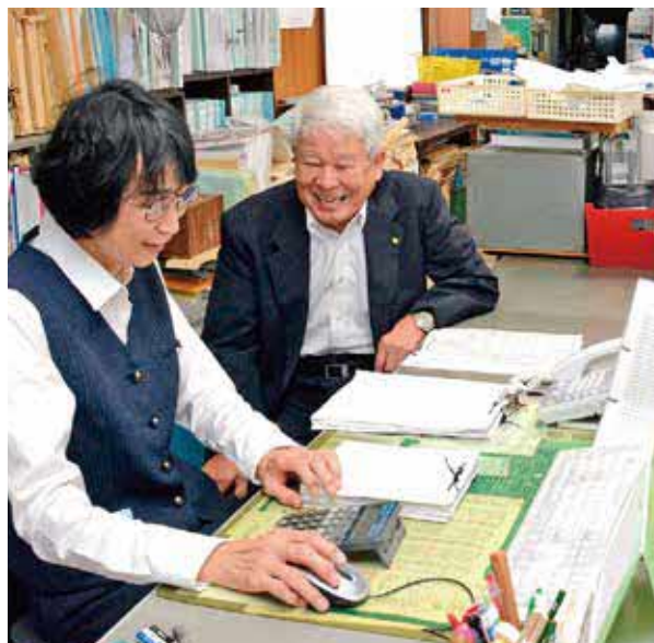
より良い会社を目指して尽力する伊藤社長(左から2人目)