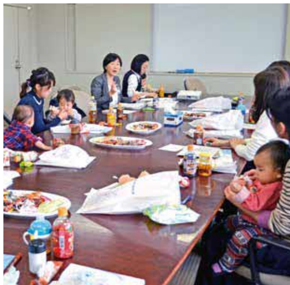
事前の意見交換、研修で復職に備える育休中の従業員ら