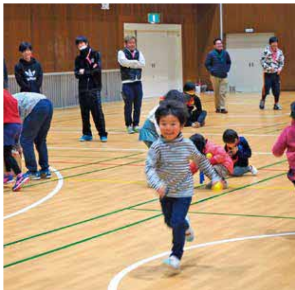
年1回開催している家族交流会。昨年は運動会を開き、親睦を深めた