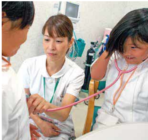
職員の子どもを病院に招く恒例行事の様子。やりがいと誇りを持って働く姿を見せている