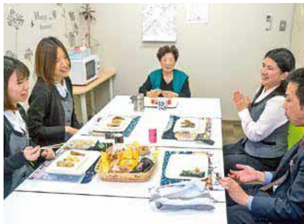
100円で総菜が購入できる「プチ社食」を福利厚生で設置。昼時は人気だ

復帰直後の主体的なキャリア形成を支援するツールとしてセルフキャリアドック制度を導入