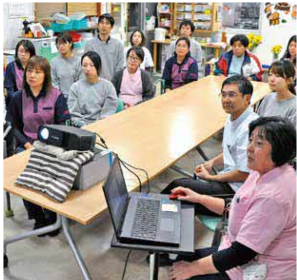
週1回開かれる院内勉強会。より良い職場にするために全員で情報を共有し、話し合っている