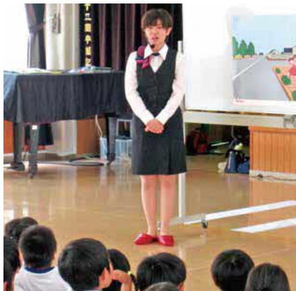
会社の制度を活用しながら仕事と家庭を両立させ、生き生きと働く女性社員