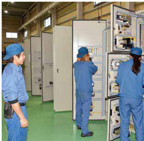
性別に関係なく全社員が活躍できる環境を整えている