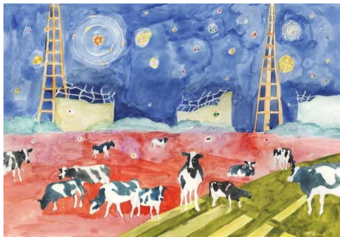
8 竹川宣彰《群落》 2011年 | 水彩・紙