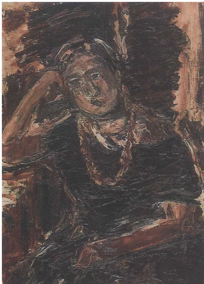
3 長谷川利行《婦人像(前田寛治夫人像)》 1937年 | 油彩・カンヴァス