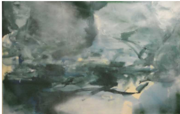
7 小林正人《画く力》 1991年 | 油彩・カンヴァス