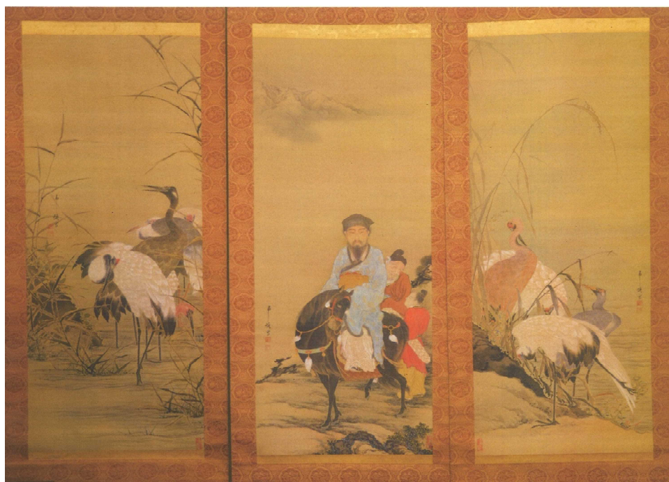
1 土方稻嶺《東方朔図》 江戸時代後期 | 絹本着色・三幅対