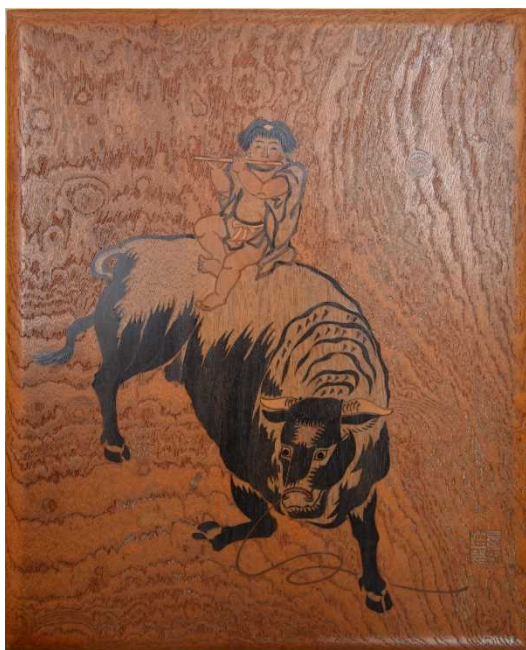
2 西村莊一郎《牛牧童嵌木硯箱》 明治初期 | 木(画像はモノクロ)