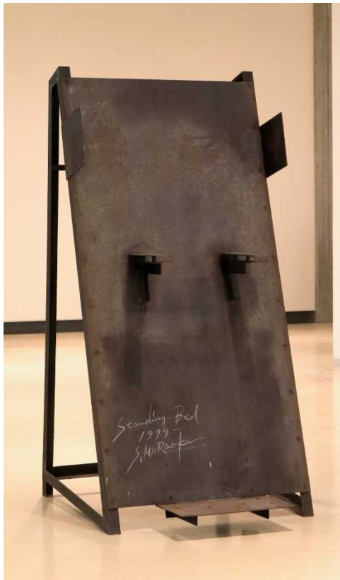
6 村岡三郎《Standing Bed》 1979年 | 鉄