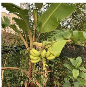
散歩中に見つけたフルーツ (バナナ・ランブータン)