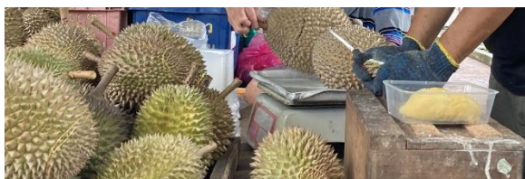
↑ドリアン 3回食べればやみつきになるとか...