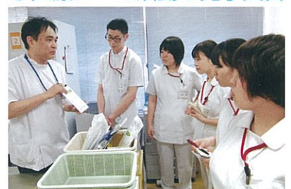
入学早期より、チーム医療の重要性を学習