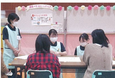
妊娠中の方を対象にした出産準備教育