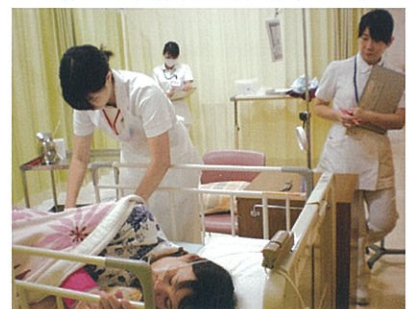
OSCEでの援助実施場面