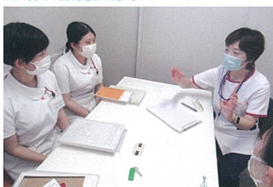
ケアの充実のために指導者を交えた実習カンファレンス