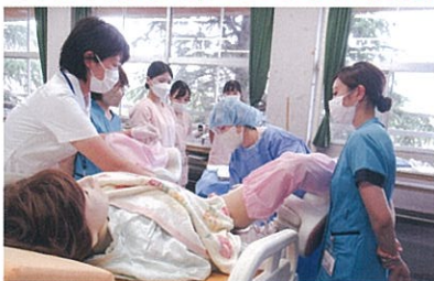
実習施設の指導者による分娩介助技術演習