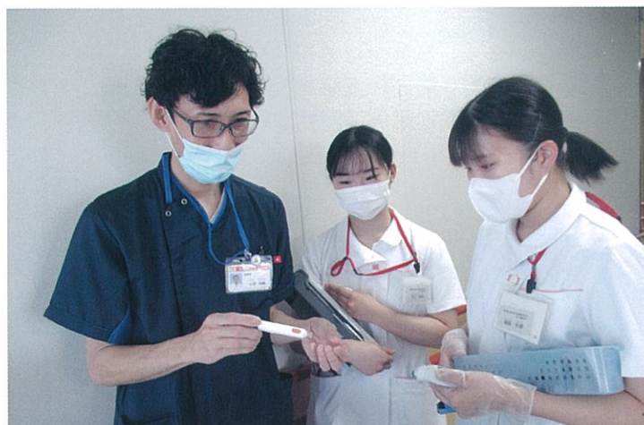
実習では、受け持ち患者さんの血糖測定が安全かつ正確にできるよう指導を受けます。