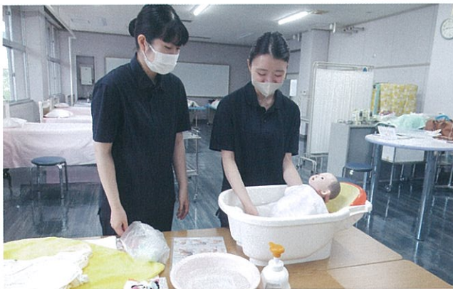
産褥期・新生児期助産技術学

分娩経過の診断に必要な知識を学び、臨地実習前には、分娩介助技術の習得に励んでいます。