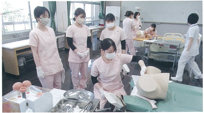
分娩期助産技術学

分娩経過の診断に必要な知識を学び、臨地実習前には、分娩介助技術の習得に励んでいます。