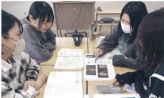
准看護師養成施設での学びや臨床での経験を更に深め、看護師に必要な知識・技術の習得に取り組んでいます。

准看護師の資格を取得した後、幅広い年齢層の仲間が、向上心に燃え、共に協力しあいながら看護師を目指しています。卒業生は県下の医療機関を中心に活躍しています。看護師資格を取得したいあなたの情熱を支援し、夢の実現に向けて応援します。