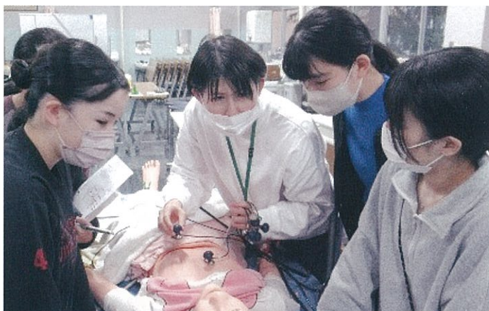
実習に向けて、学生自身が主体的に計画を立て、知識の確認と技術の練習に取り組んでいます。