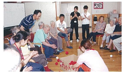
老人福祉施設でレクリエーションを企画・運営