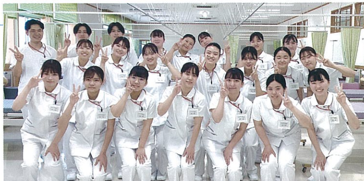
看護師としての知識や技術を身につけるために頑張ります！