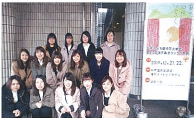
「日本子ども虐待防止学会 第25回学術集会ひょうご大会」に参加