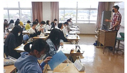
日常英会話の授業風景