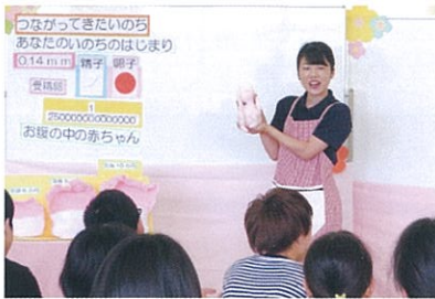
小学生を対象にした「命の教育」