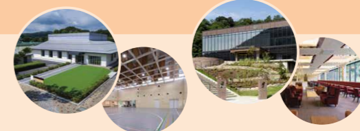
建設実績のスポーツセンターノバリアと大江ノ郷VILLAGEなど

近年は、経年変化が趣になって行く独自のデザインや、企業ブランディングなど新たな挑戦を続けています。社内では建築士などの資格取得支援、働き方改革など、社員がいきいきと働ける会社づくりに取り組んでいます。