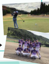
ポジションはピッチャー

高校野球部のOBチームで毎週のように試合に出ます。ゴルフにも夢中で時々コースへ。鳥取は趣味を満喫しやすい!