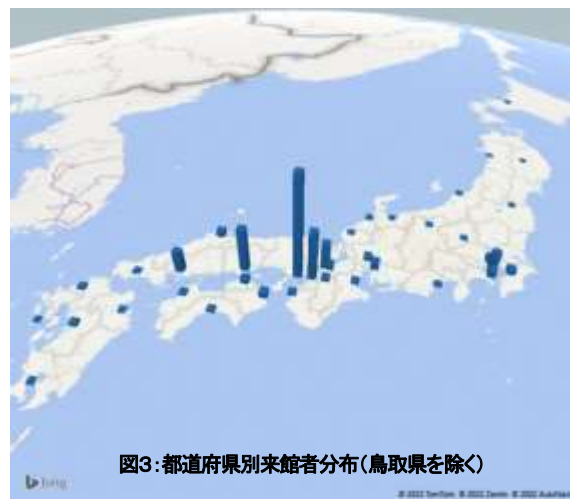
図3: 都道府県別来館者分布(鳥取県を除く)