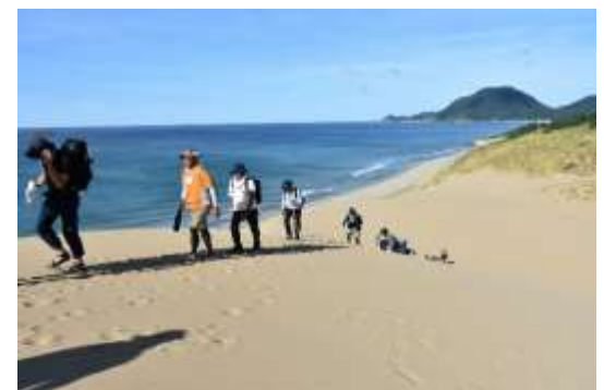
写真2: 鳥取砂丘でのトレイル風景