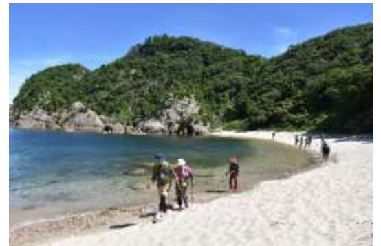
写真1: 鴨竹磯でのトレイル風景

ちなみに私は、JR青谷駅からJR佐津駅 さつ までの18コースのうちの16コース、約112km歩きましたが、一括りに山陰海岸と言っても海岸だけではなく、鳥取県側では愛犬とともに城下町や温泉街を歩き、兵庫県側では多くの漁村風景や危険な断崖絶壁などを楽しむことが出来ました。また兵庫県香美町では、地元の方との会話も楽しめて、この3年間でトレイルは、私に時間と空間の楽しみ方を教えてくれました。（裏へ）