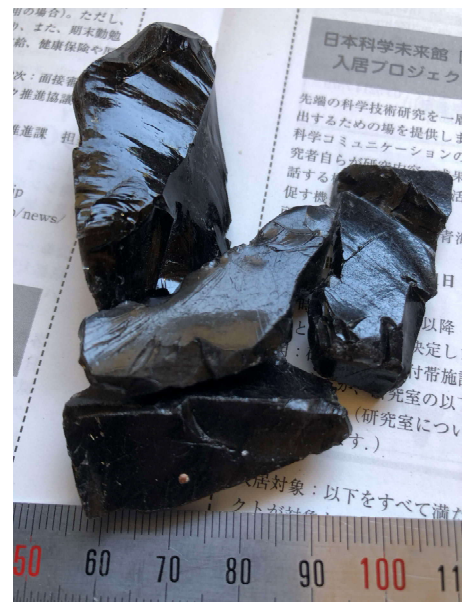
写真1 ガラス光沢を有する黒曜石 （長野県諏訪産）