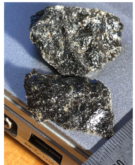
写真3 松脂岩の破断面の樹脂状光沢 (豊岡市竹野町産の松脂岩)

宮沢賢治の「銀河鉄道の夜」で、カムパネルラは銀河ステーションで黒曜石でできた地図をもらいます。子どもたちが「銀河鉄道の夜」を読んでいるのかな、と想像していたのですが、どうやら流行のゲームに黒曜石が登場するらしく、これを入手すると特別な力を発する事ができるとか。なるほど小学生の間でも知名度が高い石なのだと納得しました（松本）。