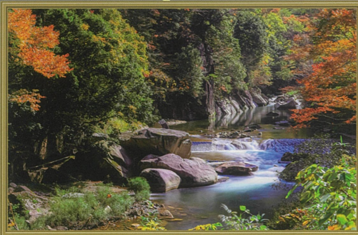
石霞溪の秋 土井垣 伸治 (日野郡日南町生山)