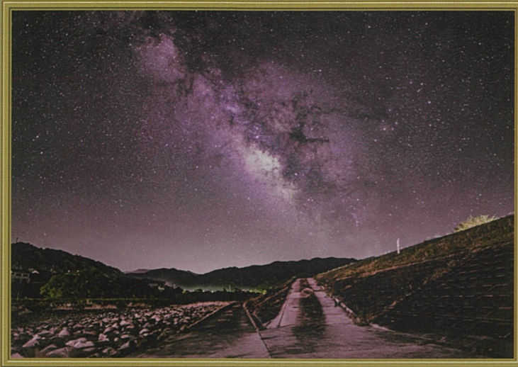
ふたつの川 村川 節秀 (西伯郡伯耆町)