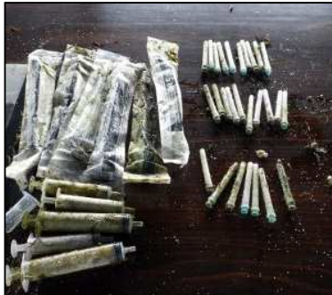
<回収した注射器・針>