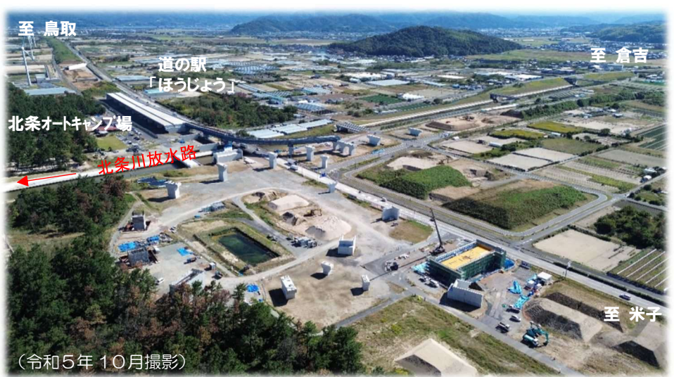
道路整備によるアクセス向上は 周辺地域の企業誘致や観光交流に貢献