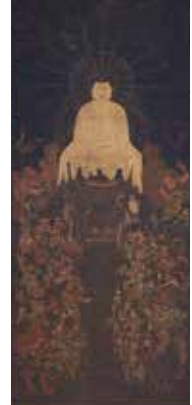
重要文化財 釈迦十六善神像 (南北朝時代、兵庫県香美町黒野神社)