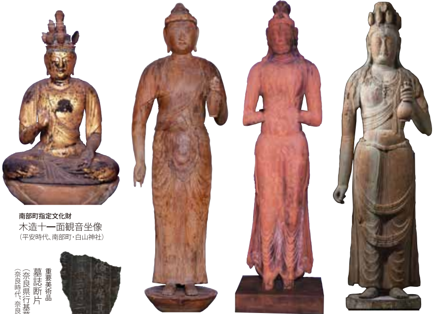
南都町指定文化財 木造十一面観音坐像 (平安時代、南都町・白山神社)