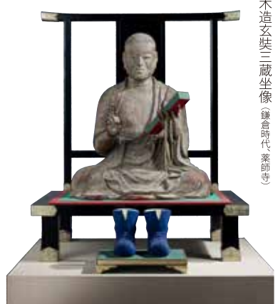
木造玄奘三蔵坐像(鎌倉時代、薬師寺)