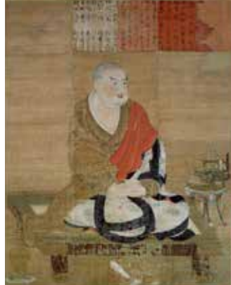
国宝 慈恩大師像(平安時代、薬師寺)