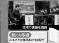
地域の課題を調べる