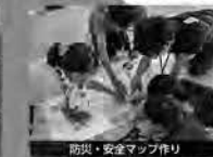
防災・安全マップ作り