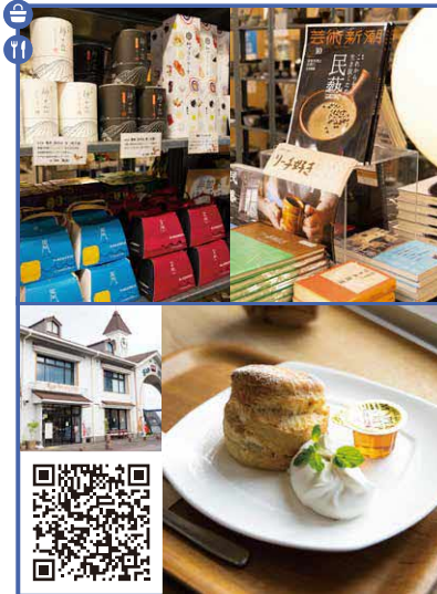
書店併設のショップでお土産やギフトを選びつつカフェで一息