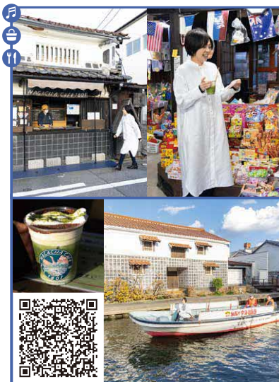
「nagachacafe1801」の茶畑ラテ片手に加茂川・中海遊覧