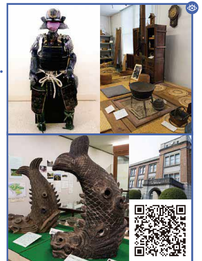
近代の生活用具や、鯰瓦(しゃちがわら)などを展示