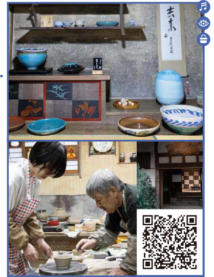
皆生温泉近くにある窯元で手ろくろでの陶芸体験