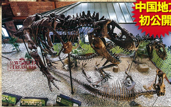
エドモントサウルスに襲いかかるティラノサウルス(アメリカでの展示風景)