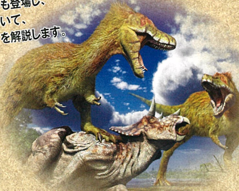
若いティラノサウルスの狩りの様子