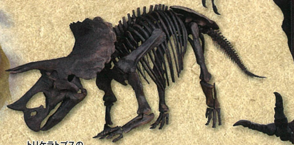
トリケラトプスの全身骨格(複製)

空間演出のクリエイティブカンパニー NAKED, INC. 初の大型恐竜コンテンツ!