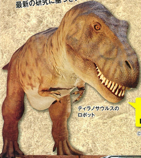
ティラノサウルスのロボット