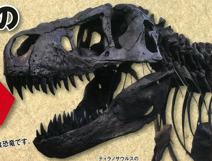
ティラノサウルスの全身骨格(複製)

世界で最も有名で、最も人気の高い恐竜ティラノサウルス。「暴君竜」の名にふさわしく、太く鋭とがった歯、頑丈で大きな頭を持つ最大級の肉食恐竜です。その他の大型恐竜や草食恐竜に加えてロボットも登場し、発掘・研究の歴史のほか、生態や能力などについて、最新の研究に基づきティラノサウルスのすべてを解説します。