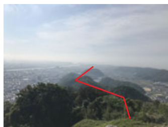
秀吉軍に対して鳥取城への補給路を守った丸山から鳥取城までの尾根上の山城跡(赤線部分)

教科書の「3人の武将と天下統一」は、織田軍(羽柴秀吉)の因幡攻めを受けた当県には大きく関わりのある単元です。県内には504城もの中近世のお城があり、その中には織田軍との戦いに関係した山城も多くあり、その山城は以外に身近にあります。教科書の単元にも結びつく地元のお城を教材とした授業づくりをします。