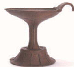
他地域との交流を示す青谷上寺地遺跡出土の花卉高杯 北陸地方などの日本海沿岸の遺跡で出土する美しい木製の高杯

鳥取県の遺跡というと国史跡青谷上寺地遺跡、国史跡妻木晩田遺跡の弥生遺跡をすぐ思い浮かべるかもしれませんが、実は県内には約100の縄文遺跡、約200の弥生遺跡があり、他地域とも交流していたものもあります。なぜ、他地域と交流するのか？当時の社会のようすは？などをポイントに地域にある縄文・弥生遺跡を教材にした授業づくりをします。