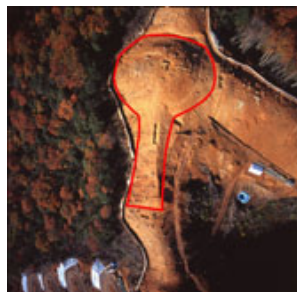
山陰最古級の前方後円墳 本高14号墳

教科書には前方後円墳が古墳の代表かのように紹介されています。しかし、古墳は前方後円墳だけではありません。県内の全古墳数約13,000中、前方後円墳は約250。決して数の多くない前方後円墳が教科書に取り上げられているなぞ解きをしながら、地域にある古墳を教材にした授業づくりをします。