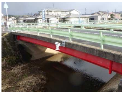
危機管理型水位計の設置例