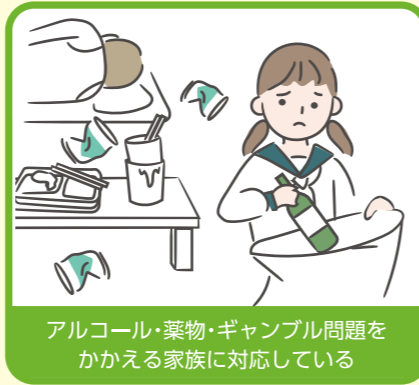
アルコール・薬物・ギャンブル問題をかかえる家族に対応している