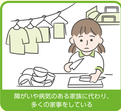
障がいや病気のある家族に代わり、多くの家事をしている