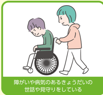
障がいや病気のあるきょうだいの世話や見守りをしている