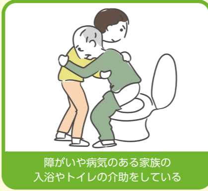
障がいや病気のある家族の入浴やトイレの介助をしている