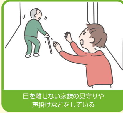
目を離せない家族の見守りや声掛けなどをしている