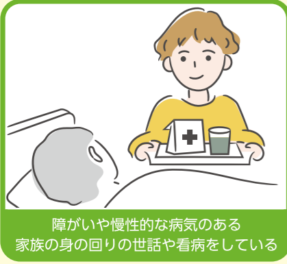
障がいや慢性的な病気のある家族の身の回りの世話や看病をしている