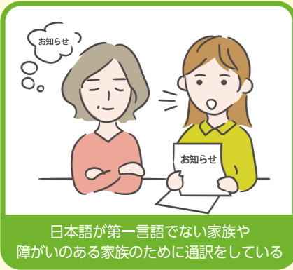
日本語が第一言語でない家族や障がいのある家族のために通訳をしている