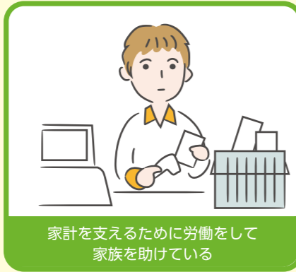
家計を支えるために労働をして家族を助けている