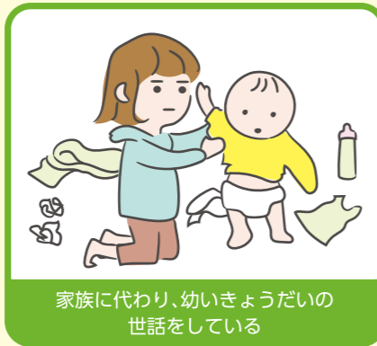
家族に代わり、幼いきょうだいの世話をしている