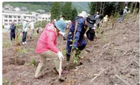
第61回鳥取県植樹祭(日南町霞)の様子

※当日は新型コロナウイルス感染症感染防止対策を整え実施しますが、体調等すぐれない方は参加をご遠慮ください。 ※当植樹祭は、令和3年中に開催する計画でしたが、新型コロナウイルス感染症感染拡大の状況を踏まえ、延期して開催することになったものです。