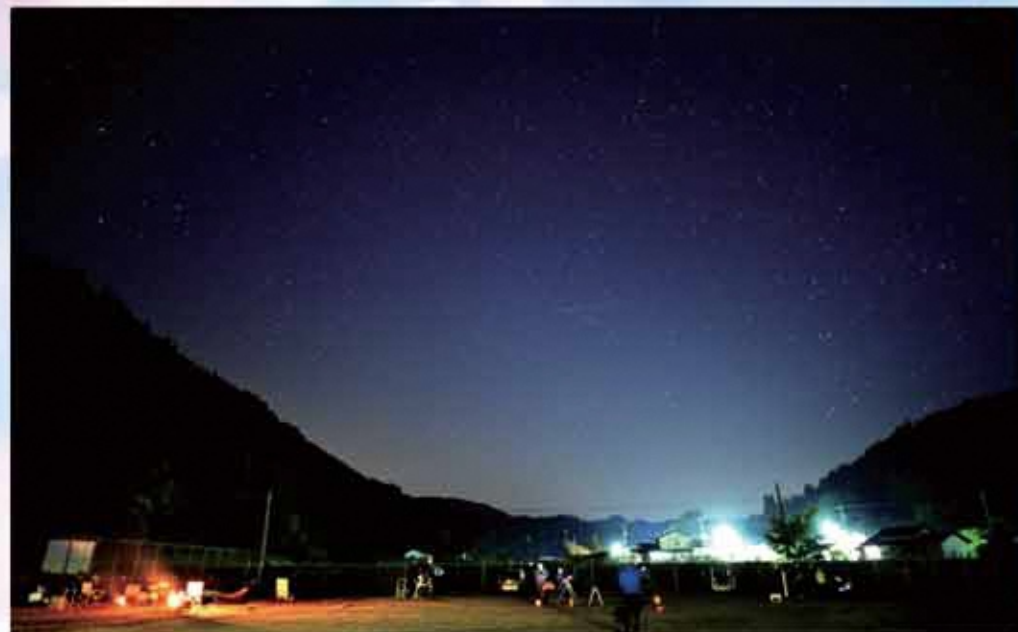
今年5月のスターパーティにちなんだ思い思いに楽しむ人たち