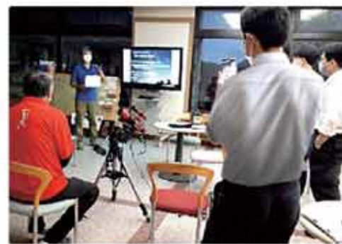
テレビ観望の操作を学ぶ皆さん