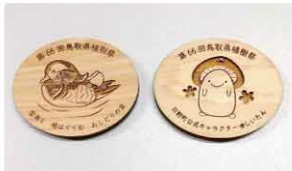
参加記念品として無料配布される木製マグネット