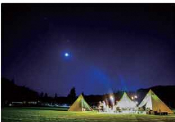
ゆきんこ村で焚き火と星空を楽しむ