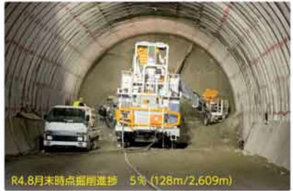
R4.8月末時点掘削進捗 5% (128m/2,609m)