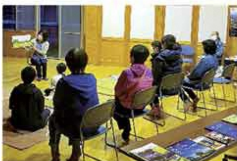
星の物語もまた楽しむ

本館の下の広場を芝生化した「芝のグラウンド オートフリーサイト」を、今年オープンしました。キャンプで焚き火をしながら星空を満喫す