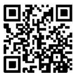
ジャマイカ 独立60周年記念祝賀演奏