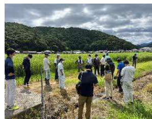
▲現地研修会の様子