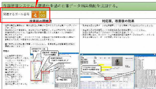
▲改善テーマの事例 関連するゴール番号 9、12

とっとりSDGs企業認証へ申請した内容を鳥取県HP(とりネット)で公開しています。