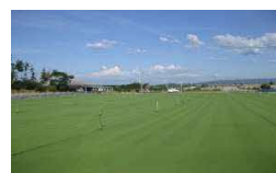
芝畑(豊かな自然環境から良質な芝を生産)▶

当社の芝生専門研究部門である「チュウブグリーン研究所」を中心に品種改良、新品種の開発等に取り組む、天然芝の普及を目指します。 今後、脱炭素社会の実現に向けた天然芝のニーズの増加を目指し、地域に安全と安心をもたらす環境に優しい事業を推進していきます。