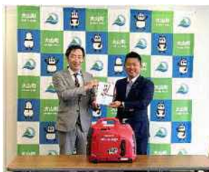
◀大山町にLPG発電機を寄贈

また、防災イベントの実施・参加を通じて、地域の方たちに災害時に役立つ情報を提供しLPガスの有用性についてPRしています。