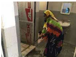
▲地域の女性にコミュニティトイレの管理を行ってもらうことで女性雇用創出にも取り組む。

とっとりSDGs企業認証へ申請した内容を鳥取県HP(とりネット)で公開しています。