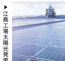
▶江島工場太陽光発電

とっとりSDGs企業認証へ申請した内容を鳥取県HP(とりネット)で公開しています。