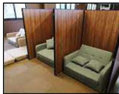
▲休憩室にリラックススペースを設置

また、従業員の要望であった、リラックススペースを休憩室に設置しました。従業員の意見を尊重し、働き続けられる環境づくりを目指しています。