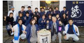
わが社の少数精鋭の従業員たち ▶