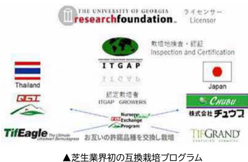
▲芝生業界初の互換栽培プログラム

協会会社、公的機関、海外の芝生先進企業等の外部リソースの経営資源を活用したアライアンスに基づき、チュウブブランドの海外販売を目指しています。