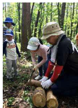
森林保全活動の様子 ▶

大山にある社有林を森林保全ボランティア活動の場所として提供し、その活動の運営と周知を実施しています。