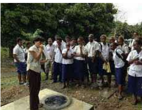
▲ソロモン諸島の学校に設置。学生に衛生教育を行う。

また、地方から海外へ展開しようとする企業に対し、様々な補助金やスキームを紹介し、ノウハウを提供しています。