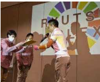
▲2022年SDGsアワードの様子