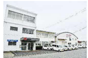
▲本社外観(鳥取市商栄町)

私たちは「オフィスのことならモリックスに」を合言葉に、トップメーカーとの強力なパートナーシップを背景に、DX化や刻々と変化するユーザーニーズに即応し続け、グループ理念に基づき、どんなに時代が変わってもお取引先が働きやすい最適な職場環境をトータルに提案する人間尊重の企業であり続け、質の高いオフィスづくりから取引先の成長を支え、豊かで安心できる社会づくりに貢献していきます。