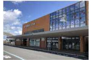
▲米子鬼太郎空港 外観

米子空港サービスでは、「働きがいも経済成長も」を一つの経営理念として、従業員一人ひとりが公私にわたって心身共に健康であり、いきいきと自由闊達に仕事に取り組んでいくことが重要だと考えています。「従業員の安全と健康の確保、快適な職場環境づくりは企業活動の基盤である」という考えの下、従業員の健康維持・増進、そして健康で元気に働くことのできる職場環境の整備に向けて、積極的に取り組んでいきます。また地域貢献の一環として、イベントへの参加や実施の他、地域の困りごとの解決の一助となるような取組を行い、地域社会との共生を図っていきます。