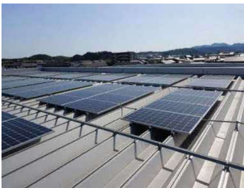
▲会社屋上の太陽光パネル

とっとりSDGs企業認証へ申請した内容を鳥取県HP(とりネット)で公開しています。