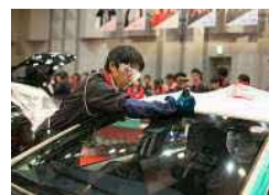
▲技術コンテストの様子

また、個人目標と達成手段を毎年掲げて、目標に向けてステップアップしていけるような人材育成をしています。個人目標を達成できるように、定期的に1on1ミーティングを実施しています。