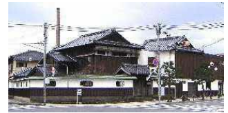
▲本社屋(境港市大正町131)

また、廃棄される可能性のある酒粕を使用したジン製造を本格化し、酒蔵の原料から出る副産物の廃棄ゼロを実現します。