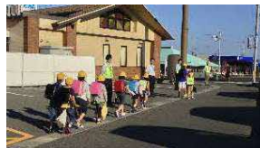
▲ 小学校の朝の登校時のあいさつ運動の様子

社員数47名の内、令和4年8月時点で女性社員が23.4%、障がい者が4.25%、Iターン、Uターンの中途採用も積極的に行っています。今後は、地域で愛される企業であるために、 地元商品の販売 や社内幹旋、小学校へのあいさつ運動やインターンシップを実施。それらの交流を通じて 地域貢献 を進めます。