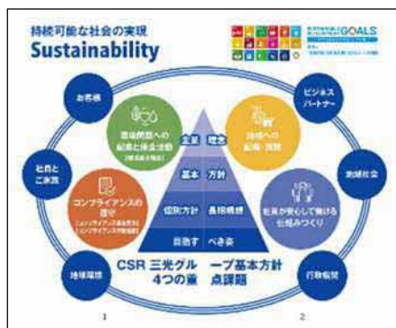
▲SDGsの達成に向けた当社の取組イメージ

また、当社の企業理念に基づく事業活動の推進が、持続可能な社会の実現やSDGsの達成に通じるものとして、社員が毎朝唱和する経営方針書に掲載しています。