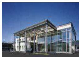
▲境港市にある本社