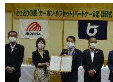
▲Jクレジット調印式(令和3年7月)

※J-クレジット制度：省エネ・再エネ設備の導入や森林管理等による温室効果ガスの排出削減・吸収量をクレジットとして認証する制度。企業等はこのクレジットを購入することで、間接的に温室効果ガスの排出削減に貢献できる。