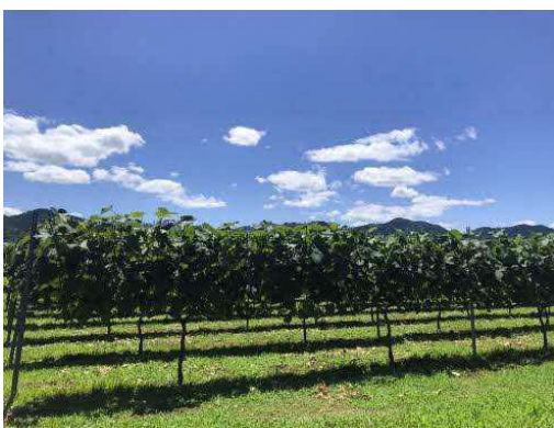
▲当社ワイン用ぶどう畑の様子

国府町麻生地区の土地でワインを造り続けるためにも、地域の自然を守り、自然を通じて人々の健康で豊かな生活に貢献します。