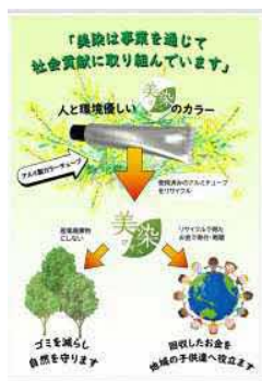
◀アルミチューブリサイクルで得た資金で、鳥取こども学園さんに小学生用のSDGsの本を寄贈