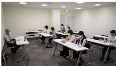
▲社会保険労務士を招いた研修

※ディーセントワーク：働きがいのある人間らしい仕事であり、自由、公平、安全と人間としての尊厳を条件とした、全ての人のための生産的な仕事のこと