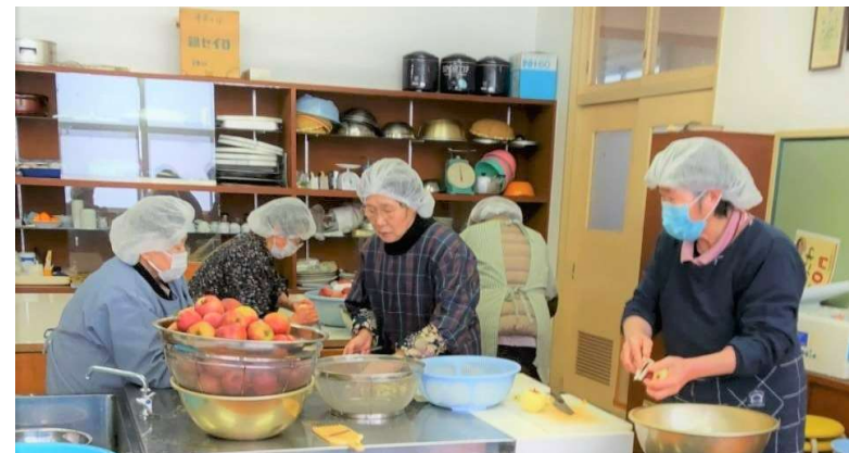
阿毘縁のりんご、 地域で採れる山菜、 季節の野菜を 使った加工品