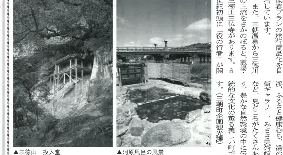
▲三徳山 投入堂 ▲河原風呂の風景

三朝町は鳥取県の中央部、中国山脈のふもとに位置する東西24km、南北19km、面積233kmの町です。四季折々に装いをこらす自然、年中通して湧きたず世界有数のラドン温泉と昔日の面影を残す名所、旧跡が数多く残っています。