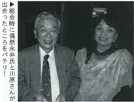
山友禪染作家川原かなよ... 大さんが好評