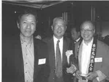
▲左から杉山さん竹歳さん山内さん