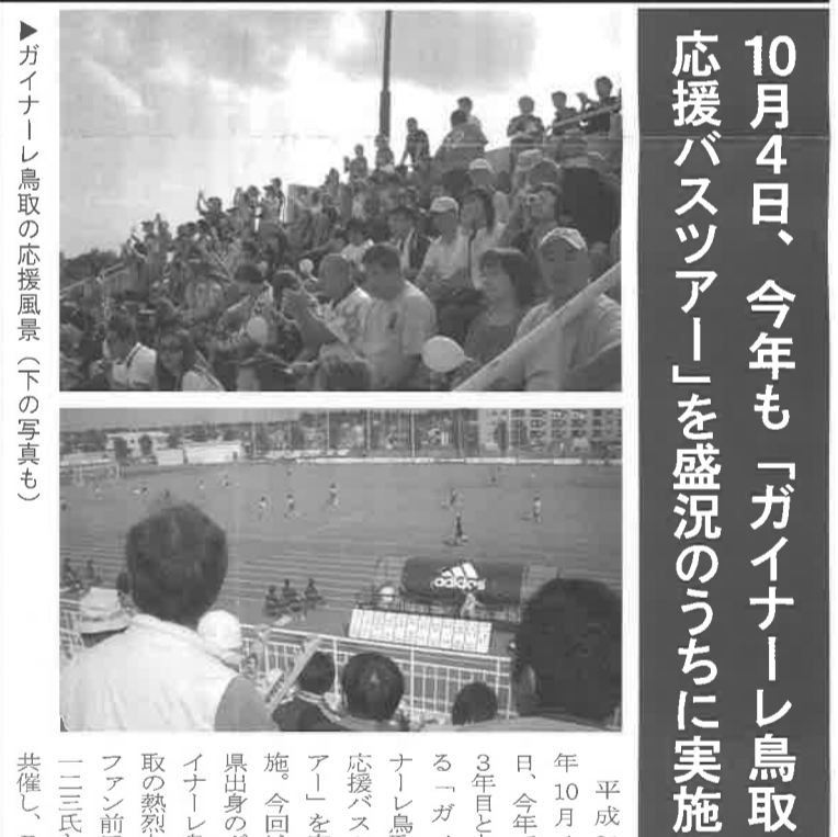
▶ガイナレ鳥取の応援風景(下の写真も)