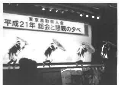
▲因幡の傘踊り雄姿