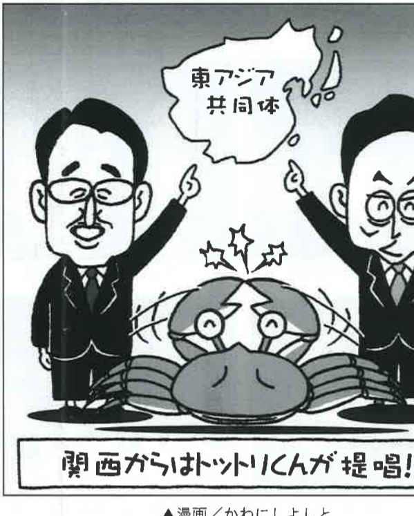
▲漫画/かわにしよと