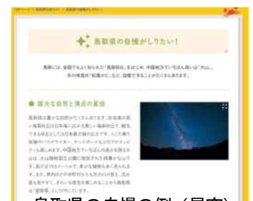
鳥取県の自慢の例(星空)