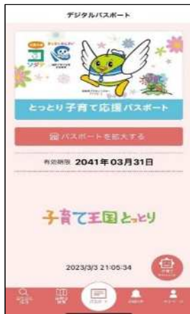
子育て応援パスポート