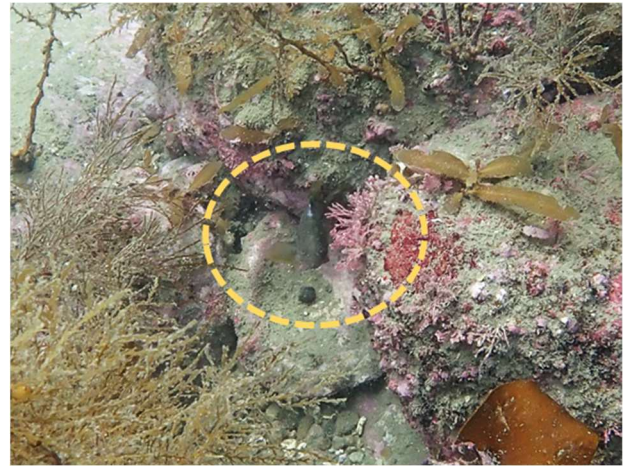
図 1 背鰭切除による標識の付いたキジハタ種苗

放流後に潜水調査を行い、網代、酒津、赤碕で転石帯に隠れている種苗を確認することができた。また、赤碕では放流 3 週間後に背鰭切除の標識を付けた種苗を確認できた。背側に標識があるため視認性が高く、潜水調査での確認が容易であった（図 1）。従来の腹鰭抜去による標識に比べて背鰭の標識は確認しやすいため、将来的には水揚時の放流魚発見率の向上が期待される。