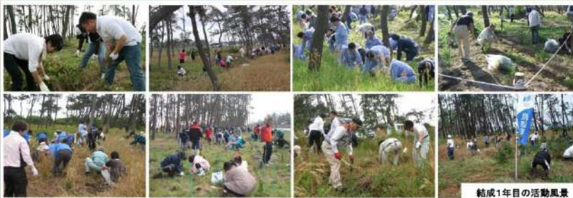
結成1年目の活動風景

どれも大変な作業ですが、幼いマツ苗の健やかな成長を願って、また弓ヶ浜マツ林の景観を保つためにそだて隊が活躍しています！！