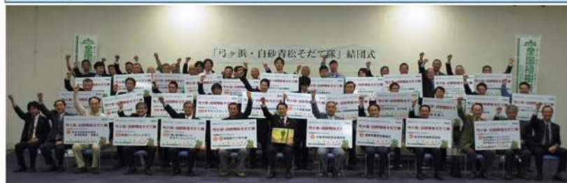
弓ヶ浜・白砂青松そだて隊の結団式(平成24年4月26日)

「アダプト」とは「養子にする」という意味です。「弓ヶ浜・白砂青松アダプトプログラム」では、参加団体を「弓ヶ浜・白砂青松そだて隊」と命名し、弓ヶ浜マツ林の親となって育てていただいています。