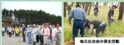
地元自治会の保全活動

生活や産業を潮風から守り、地域の生活を支えるものであり、これまで住民が一斉清掃を行うなど大切にされてきました。平成20年には地元自治会による保全活動団体も発足し、本格的なマツ林の保全活動が行われていました。