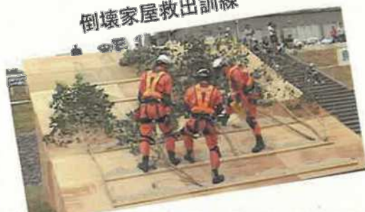
倒壊家屋救出訓練