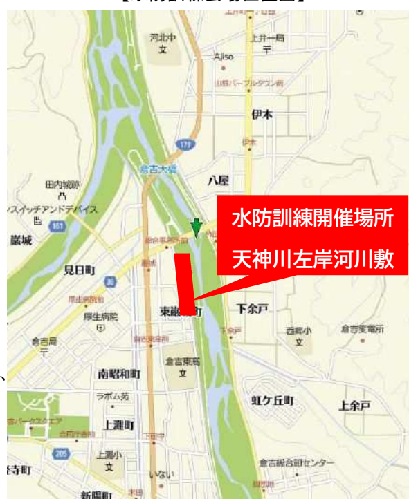
【水防訓練会場位置図】