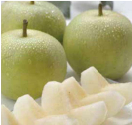
ととりの梨 ～栽培から100年を超える歴史～ 収穫時期/二十世紀：8月上旬～9月中旬