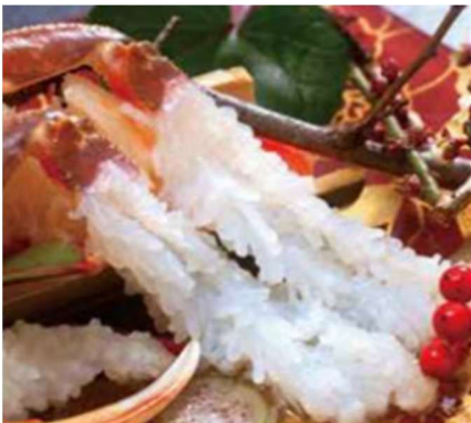
松葉がに ～冬を代表する鳥取の味覚～ 漁獲時期/松葉がに：11月上旬～3月中旬