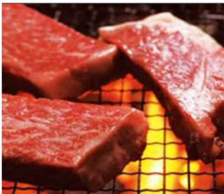
鳥取和牛 ～ブランド牛のルーツは鳥取にあり～ 鳥取和牛ブランド「オレイン55」は絶品。