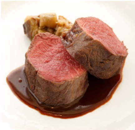
とっとりジビエ ～豊かな鳥取の自然の恵み～ 自然が生んだ、力強く、生命力に溢れたご馳走。