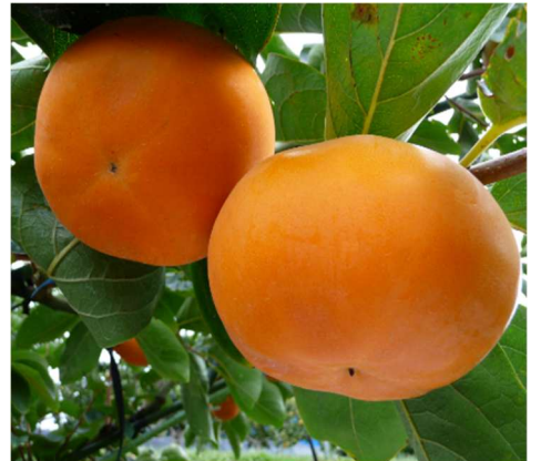
ととりの柿 ～上品な甘さと口の中でとろける食味～ 収穫時期/9月下旬～12月上旬