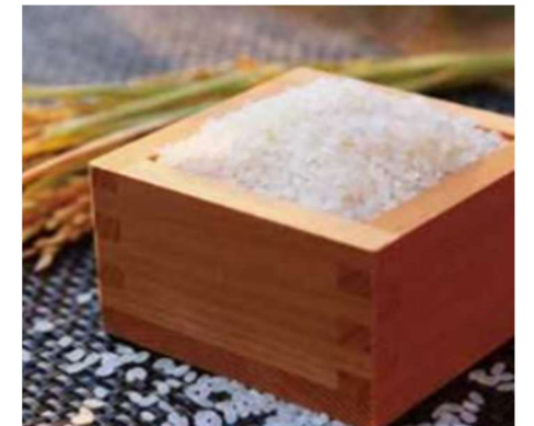
ととりのお米 ～豊かな自然が育む鳥取米～ 星のように輝くお米鳥取県オリジナル品種「星空舞」。