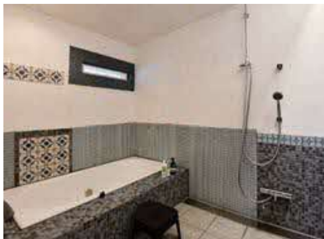
(写真上・右下) 細かいタイル細工が美しい洗面所と浴室。宿で過ごす時間が愛おしくなる。 (写真左下) 「暮らすように過ごしてほしい」と、コンパクトながら設備充実のキッチンを設置。