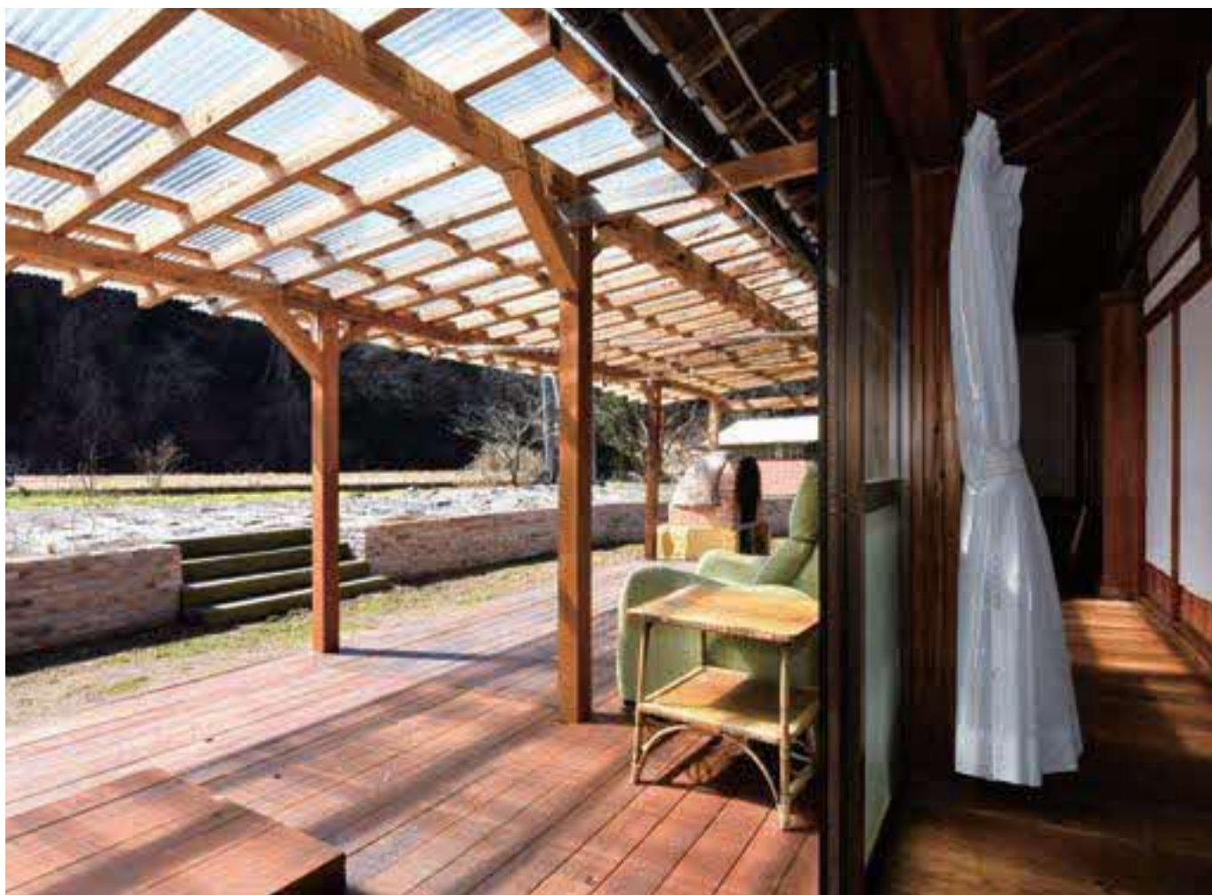
2回目の改修で造った屋根付きのベランダ。床板の一部を開けると砂場と囲炉裏が登場する。子どもたちの遊び場であり、友人らとBBQを楽しむ憩いの場でもある。