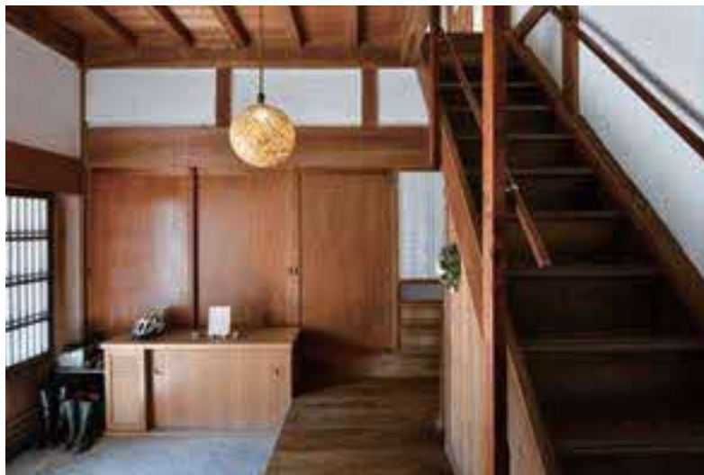
昔ながらの日本家屋の情緒を残す玄関。土壁だったところは、家族で力を合わせて漆喰を塗った。