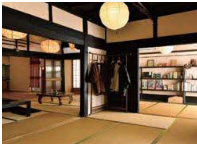
玄関を入ってすぐの和室。