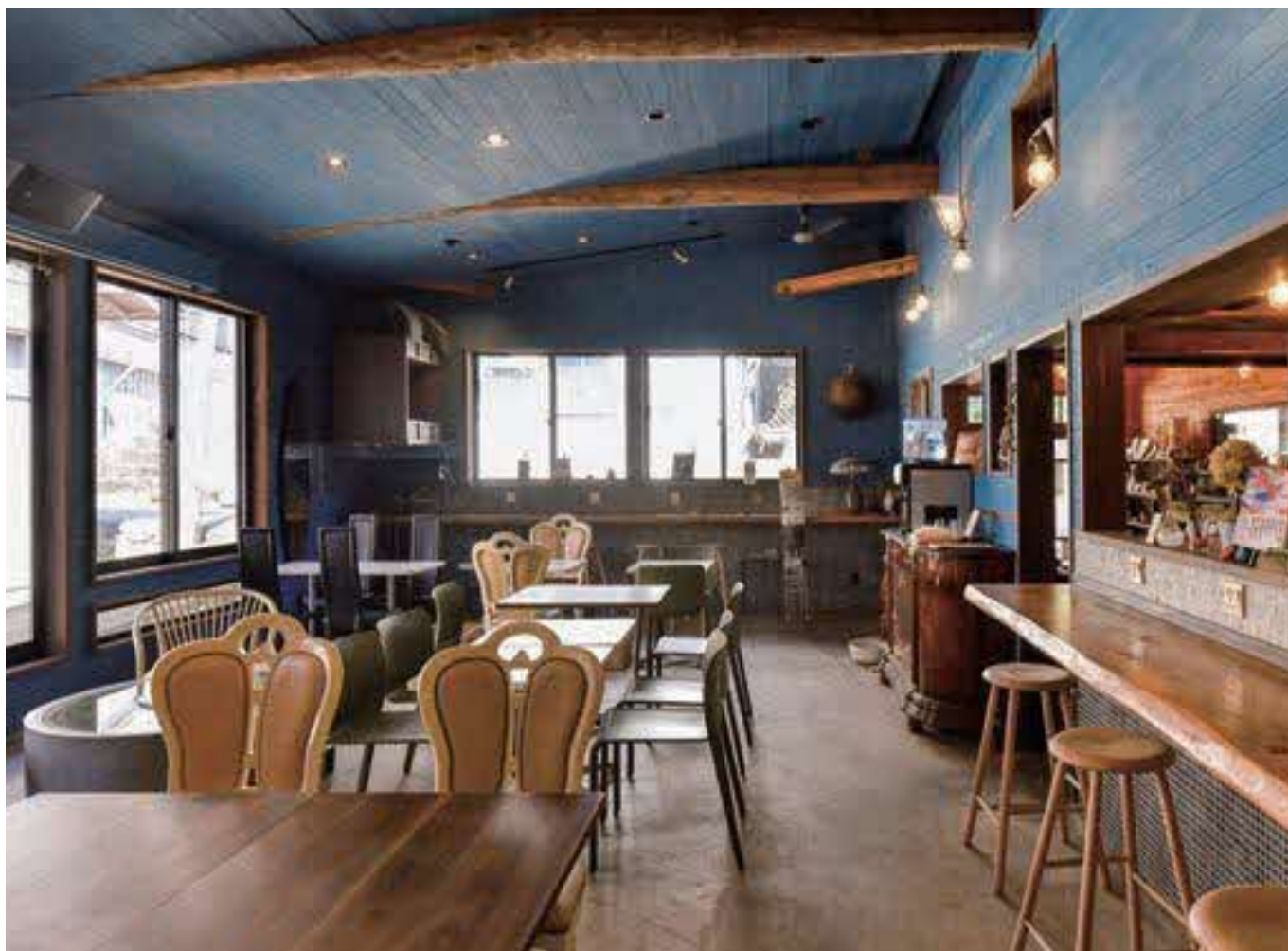
カフェスペース(写真上)とエントランス(写真下)。何度も塗り直したという壁の色、タイル張り、照明や電気スイッチカバーといった備品で1970年代を意識した雰囲気に統一されている。想定外に床下から現れた石積みの井戸は、ガラスのテーブルを載せてカフェの特等席に。

「まさかここがカフェになるなんて」。かつては編み物教室としてにぎわっていたが、空き家となっていた建物の大変身に、近隣住民はそう感動したという。智頭町にある野生酵母パン&ビールの店「タルマーリー」のオーナーが一目見て気に入り、カフェと一棟貸しの宿を融合した2号店を構想。費用がかさむことは分かっていたが、「このままでは朽ちて無くなる。再び人が集う場にしたい」という強い思いにより改修がスタートした。