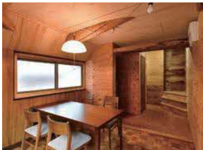
(写真上・左下)1階に2部屋、2階に4部屋ある個室は全てフローリング、施錠&エアコン付き。 (写真右下)2階のリビング。ここを通過して各個室へ向かう。