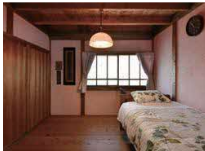
(写真上・右下)2階の和室と、廊下を挟んで反対側にあるフローリングの個室。 (写真左下)1階のゲストルーム。納屋だったところとは思えないくらい美しい仕上がり。