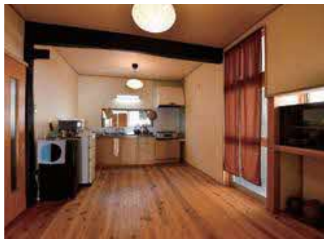
(写真上) 玄関前の庭だった部分に新設した洗面所。建具を再利用し、和の雰囲気に統一している。 (写真左下) 一番奥にはこぢんまりとした板の間も。 (写真右下) キッチンには民俗文化を感じる鳥取の陶磁器を用意。