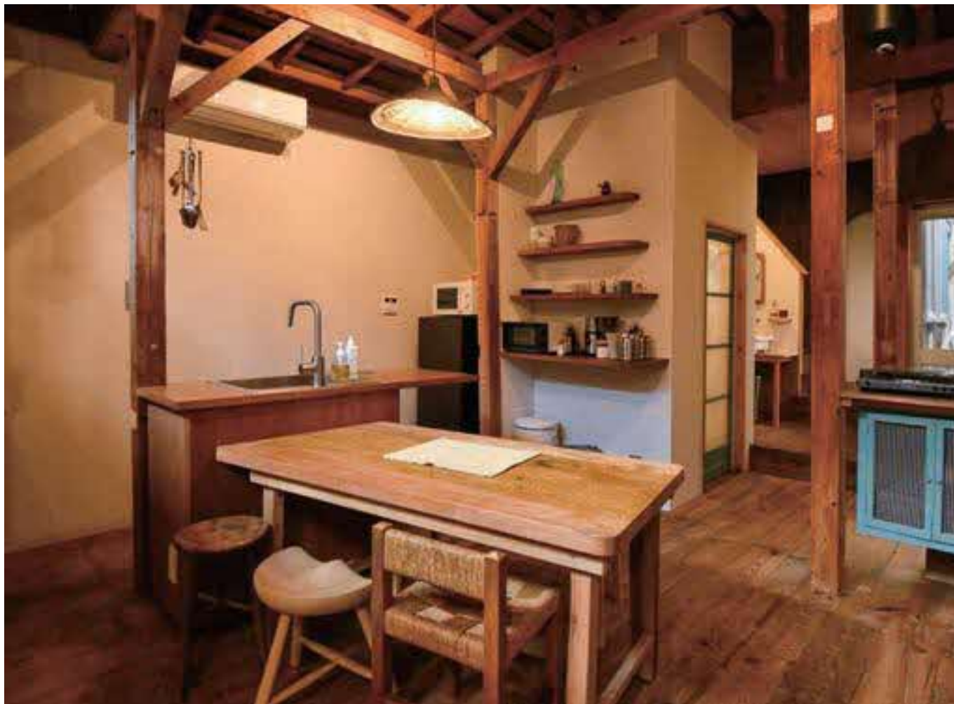
1階のリビングルーム。左側はキッチン。中央の廊下左側にシャワー室・洗面所・トイレがあり、その突き当たりが寝室。一貫したコンセプトと斬新な発想力で、コンパクトなスペースの中に来訪者を魅了する心地良い空間を実現している。

鳥取市気高町の浜村温泉街にある一棟貸切型の宿泊施設「HamaVilla」のコンセプトは、「本と音楽に耽(ふけ)る」こと。ただ寝泊まりするだけでなく、カルチャーに触れる体験の提供にも重点を置く。ゆえに施設内には、鳥取市内のレコードショップがセレクトしたCDやレコード、湯梨浜町の書店の選書がズラリ。そして、コーヒーを片手にゆったり過ごせるスポットが幾つも設けられている。中でも中2階下の“洞窟”スペースは独創的。リビングとつながっていながら包み込まれるようなプライベート感があり、不思議に落ち着く空間だ。