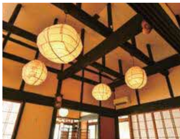
大きな梁を使った小屋組。この家の歴史を物語っている。

明るく広々とした4つの畳の間。平屋建てながら、天井を吹き抜けにしたことで開放感が増している。空間に浮かぶ佐治和紙の照明灯はまるでぼんぼりのよう。久しぶりに田舎に帰ってきたような懐かしい気持ちになり、「ただいま」と言いたくなる。