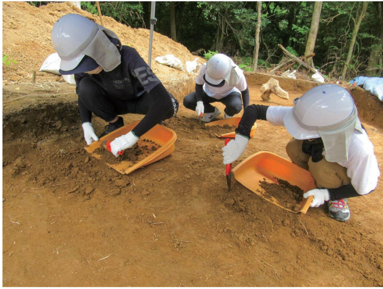
フィールドワーク「発掘調査」