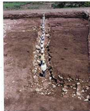
屋敷を区画する溝（SD7） (南から撮影)

勝田川沿いの自然堤防上に築かれた平安時代末から鎌倉時代、室町時代の遺構、遺物が残る屋敷跡です。勝田川を背にして、L字状に区画する溝（幅2.5～3m）が設けられ、方1町（約100m四方）の方形館跡と推定されています。文献史料の検討から「勝田荘」に関係する可能性が高く、居館の規模や屋敷内で行われた鍛冶操業の様子から、勝田川流域の在地武士団、在地領主の屋敷と考えられます。