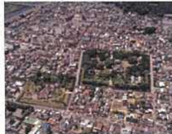
(参考) 国史跡足利氏宅跡（観阿寺）：中央右

室町時代には国ごとに置かれた守護が政庁として守護所を領国内に設けます。守護所は室町幕府の花の御所がモデルとなったといわれますが、単なる屋敷ではなく外周の土塁や堀を強化し、防御力を高めた方形館の形（例：足利氏宅跡）をとっていました。