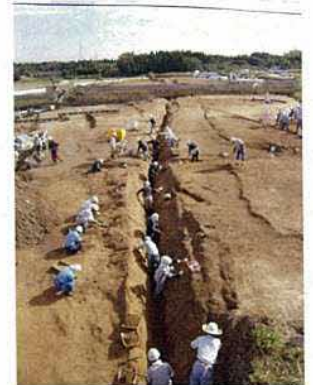
屋敷の南辺を区画する溝（SD18） (西から撮影)

大山山麓の丘陵地にあり、堀によって囲まれた鎌倉（Ⅰ期）、室町～戦国時代（Ⅱ期）の屋敷跡です。屋敷地は堀によって区画され、Ⅱ期には堀（幅約3m）を四方に巡らせ半町四方から一町四方に拡充されます。屋敷地内には掘立柱建物や井戸、墓が確認され、国内遠隔地や中国大陸から搬入された陶磁器類が出土していることから、在地領主の屋敷と考えられます。