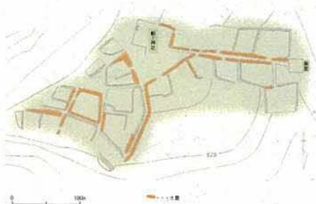
船上山行宮跡 縄張り図