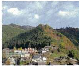
(参考) 国史跡 千早城

鎌倉時代以降、集落の一面を溝によって区画した領主の屋敷が各地に登場します。やがて屋敷の中から四周に塀をめぐる、堀や土塁によって防御した方形館があらわれます。鎌倉時代末から南北朝期には、合戦時に高く険しい山を天然の要害とする山城（例：千早城）が登場します。険阻な山中に築かれた山岳寺院も一時的に城として利用されました。