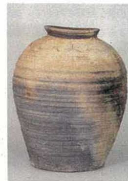
主曲輪から出土した備前焼壺