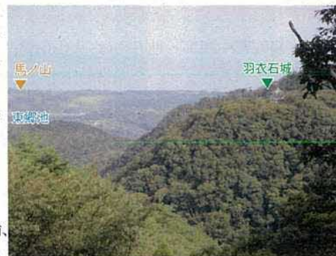
羽衣石所在城（十万寺）から北を望む

羽衣石山に築かれた伯耆の有力国人南条氏累代の居城です。東伯耆で最大級の規模を誇り、頂上から延びる枝尾根上には曲輪が連続しています。古文書では、尼子氏により城を追われた南条宗勝が永禄年間にこの城を回復したとされ、その後、天正10（1582）年に落城するものの、天正12（1584）年頃には南条氏が城に復帰し、以後関ヶ原の戦いまで存続します。発掘調査の結果、主曲輪、帯曲輪で16世紀代を中心とする陶磁器類が出土しています。