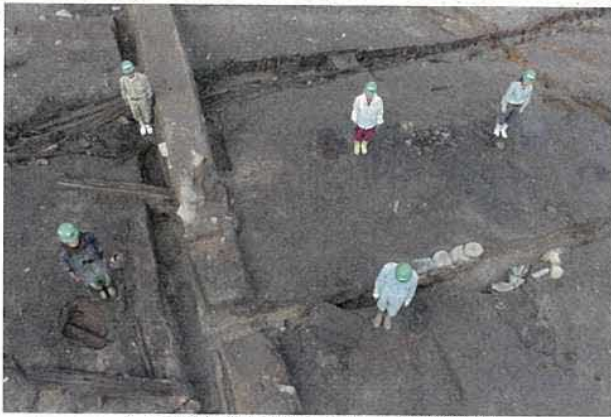
ムラの中央に築かれた大型建物跡