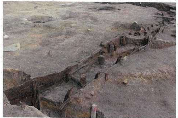
板や杭で護岸された水路