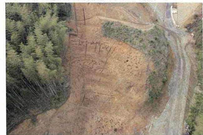
急斜面の居住域と建物構造