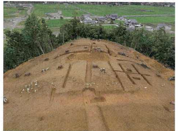
重山1号墳丘墓 (弥生墳丘墓)

乙亥正屋敷廻遺跡に隣接する丘陵頂部には、弥生時代後期の墳丘墓である重山1号墳丘墓が築造されています。方形で、貼石を持つ大型の墳丘墓で、勝谷地域を治めた首長の墓と考えられます。