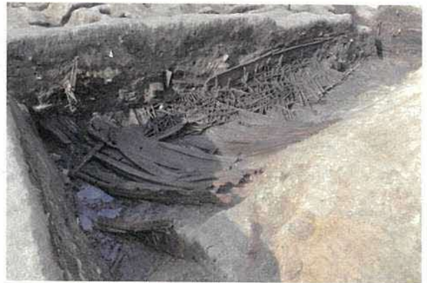
谷部に大量の投棄された建築部材

谷部の低地部は湧水が著しく、板や杭によって護岸された水路が数多く整備され、人々が水をコントロールすることに苦心した様子がうかがえます。集落内の排水を行う一方で、導水により生活用水としても利用していたと考えられます。