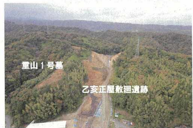
乙亥正屋敷廻遺跡と重山1号墳