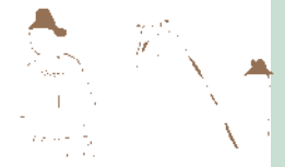
鳥取市青谷横木遺跡出土の板絵