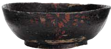
鳥取市 下坂本清合遺跡出土の漆器椀

参加費 [申込先] 鳥取県埋蔵文化財センター 申込み [申込方法] 2/1金9:00~3/15金まで電話にて受付(先着順) TEL:0857-27-6711(平日のみ)