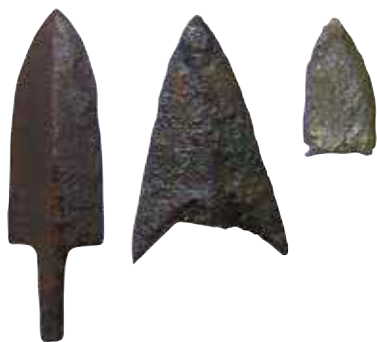
鳥取市 乙亥正屋敷廻遺跡出土の銅のやじり