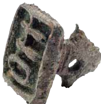
鳥取市 下坂本清合遺跡出土の古代の銅印