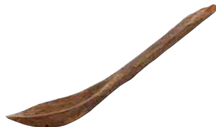
鳥取市 松原田中遺跡出土のさじ