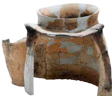
鳥取市 高住牛輪谷遺跡出土の古墳時代のかまど