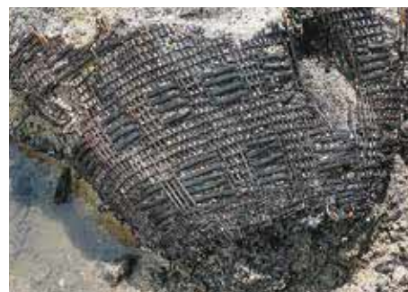
鳥取市 高住井手添遺跡出土の縄文時代のカゴ