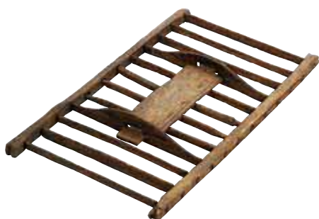
鳥取市 松原田中遺跡出土の田下駄