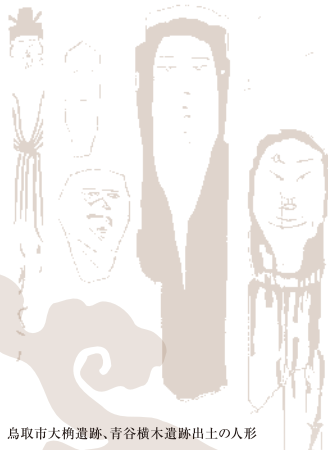
鳥取市大納遺跡、青谷横木遺跡出土の人形