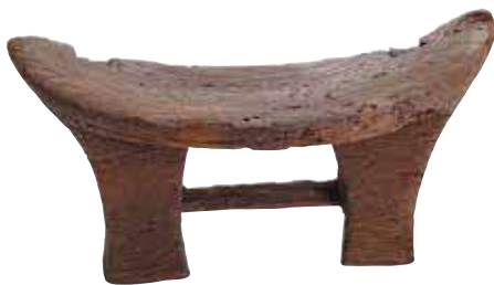
鳥取市 青谷横木遺跡出土の腰掛