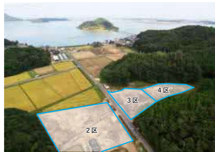
良田平田遺跡全景（南西から）

遺跡の最盛期は古代（7世紀末から9世紀頃）で、良田地区の旧地名である「荒田」と記された墨書土器や、中国地方最古と考えられる「前白木簡」、国郡郷及び人物の名称が記された記録木簡が見つかるほか、円面硯、銅製帯金具など古代の役所に関連したものが多数出土しています。