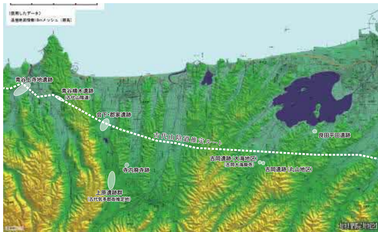
良田平田遺跡出土軒丸瓦 関連遺跡分布図

DATA 単弁十二弁蓮華文軒丸瓦 最大長：11.6cm、最大幅 16.8cm、最大厚 3.3cm 瓦当裏面ナデ調整