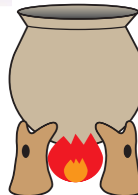
土製支脚使用イメージ