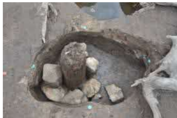
柱根と根石検出状況