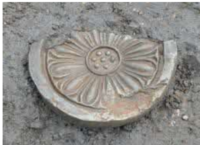
← 軒丸瓦の出土状況

ただし、現時点では良田平田遺跡からは 1 点しか出土していないため、建物がどこにあったのか、どんな建物（寺院か役所か）だったかなど、まだ謎が残っています。