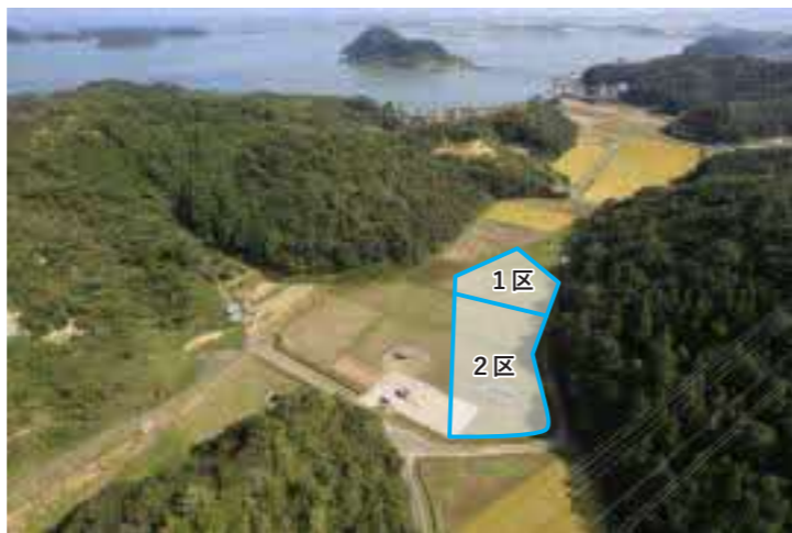
良田中道遺跡全景（南西から）

弥生時代から古墳時代には、木製の水利施設のある溝を造り、木製構造物を設置するなど水をコントロールして、当時では米作りに向かないこの土地で水田開発を行っていたようです。古墳時代後期（6世紀）以降は、狭い自然地形を利用した水田区画が、現代の圃場整備が行われるまで踏襲されたと考えられています。