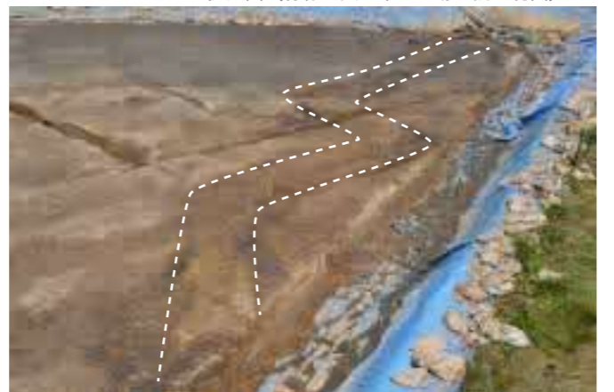
曲がりくねった擬似畦畔