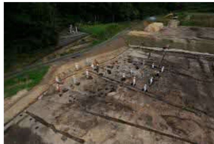
3区 掘立柱建物跡1・2

柱の根元の周りに石を置いたり、柱の下に石を置いたりして、 ふとうちんか 不同沈下（柱が不揃いに沈むことによって、建物が傾くこと）を防止する工夫が行われています。