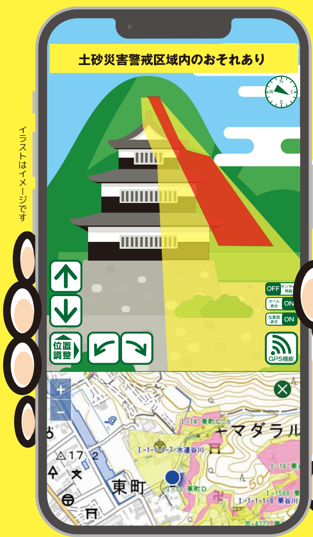
イラストはイメージです