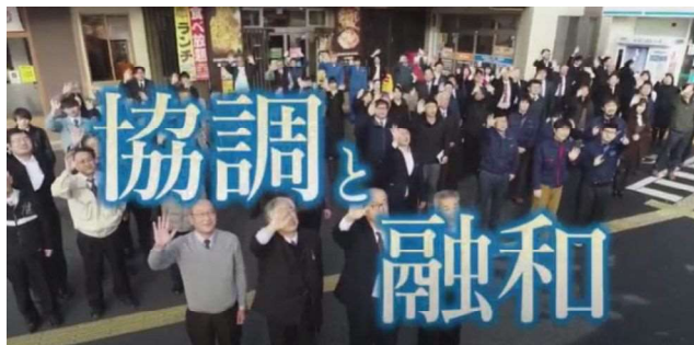
PR 動画 YouTube 配信

現在の若年求職者への広報手段としてYouTubeを取り入れたことと、組合員一社の紹介に加え組合という組織力をPRするため組合活動の紹介も動画化したことで、若者に動画・映像を観て理解、納得してもらうことが可能となった。今後は自社独自のHP制作の支援、YouTubeなどを自社制作し、SNS社会への対応を積極的に推進することにより、組合員の組合事業参画、組合への帰属意識の向上、若年者の人材確保に繋がっていくことが期待される。