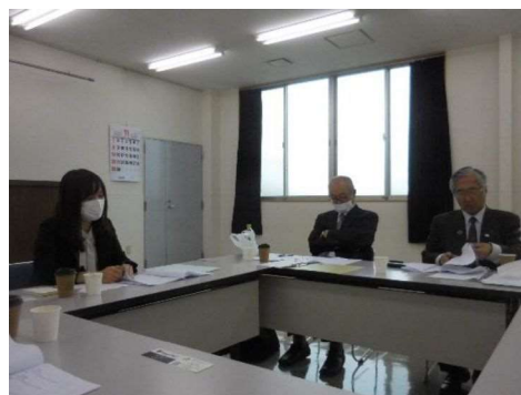
検討委員会を立ち上げ映像内容協議