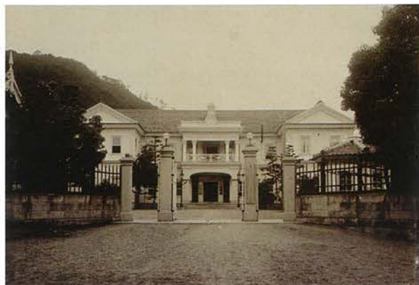
明治18年建築の庁舎（2代目）

鳥取県の政治の中心となる建物が、県庁舎です。昭和37年（1962）に建てられた現在の県庁舎は、4代目の建物になります。