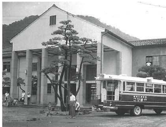
昭和19年建築の庁舎（3代目）