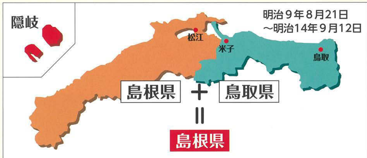
東西に細長い島根県

鳥取県がなぜ島根県に合併されたのか、はっきりした理由は分かっていません。ただ、当時の明治政府には、江戸時代に石高 こくだか *1が大きかった藩や幕末に勢力を伸ばした藩を取り除くという方針がありました。ちなみに、鳥取藩は32万石で、全国で13番目の石高でした。