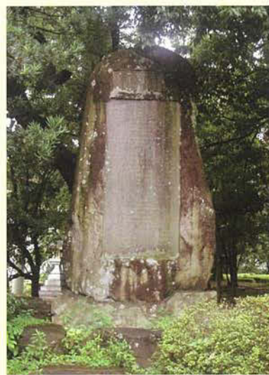
因伯新道紀功碑 いんぱくしんどうきこうひ *2

また、士族授産として、北海道移住政策を行い、釧路 くしろ や岩見沢 いわみざわ などに士族を移住させました。その一方で、鳥取に残った士族に、養蚕 ようさん ・製糸業（蚕 かいこ を育てて生糸を作る）に取り組ませることにしました。