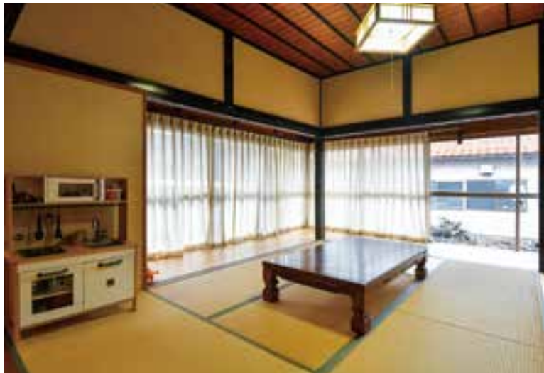
(写真左) 各部屋をぐるりと取り囲む広縁を、部屋の一部として使用。家の中に明るい陽光と爽やかな風を入れてくれる。 (写真上) リビングに隣接する畳の間。端正な和室の魅力をそのまま生かした。