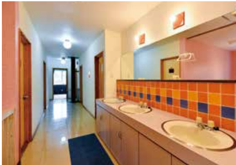
(写真上)2階の廊下に並ぶ洗面所コーナー。 ピピットカラーのタイルに気持ちが明るくなる。 (写真左)階段ホールも鮮やかな色合いで 旅気分を盛り上げてくれる。