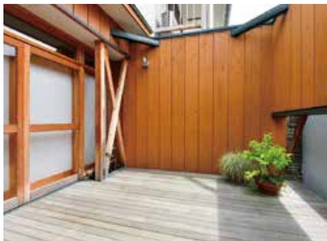
(写真上・右下) 倉庫跡に新設したウッドデッキ。1階部分だけ残した外壁のおかげで周囲の目を気にせず寛ぐことができる。 (写真左下) 対面のシステムキッチン。親族が集まったときも使いやすい。