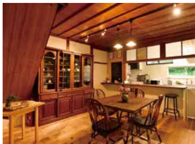
(写真上・左下) 窓からの眺めに癒されるカフェスペース。気に入った作家の食器でコーヒーやハーブティーを楽しむこともできる。 (写真右下) カフェの奥にある調理場。カウンター付きでメニューの受け渡しがしやすい。