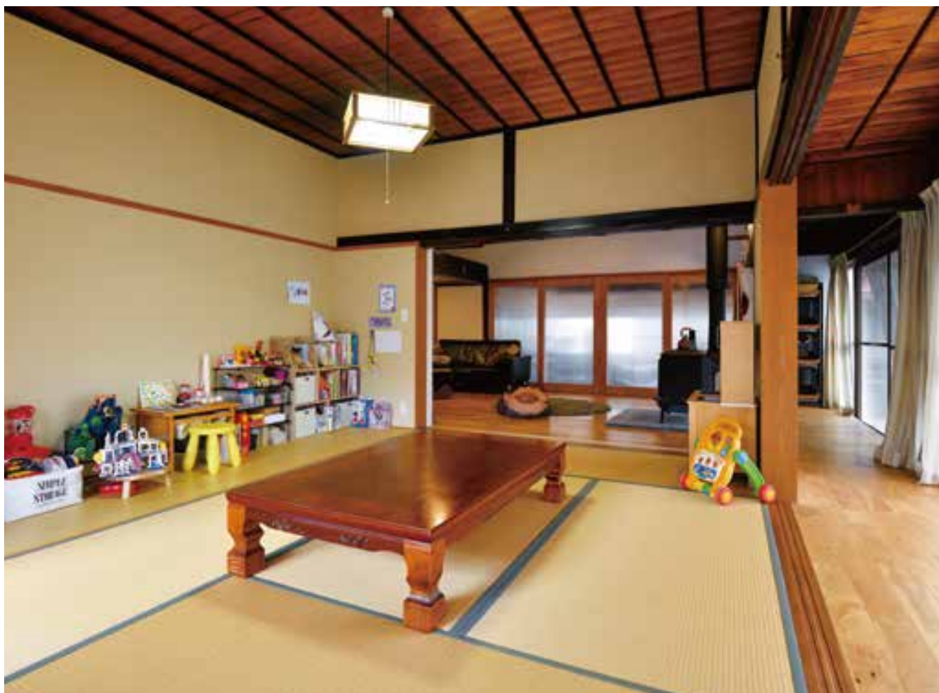
畳の間は幼い子どもたちの遊び場所でもある。個室感がありながら、遮るものがないので目が行き届く。 押入があったところは板場に改修し、現在はおもちゃ置き場として使用している。