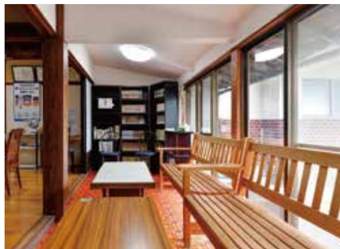
(写真上) 手話動画を撮影するスタジオ。撮影しやすいよう壁紙は白一色、機材もそろっている。 (写真左下) 利用者を出迎える玄関ホール。様々な情報を視覚的に伝えられるよう掲示板やパンフレットスタンドを設置している。 (写真右下) 広縁には本や雑誌が置いてあり、お茶を飲みながら読書を楽しむことも。