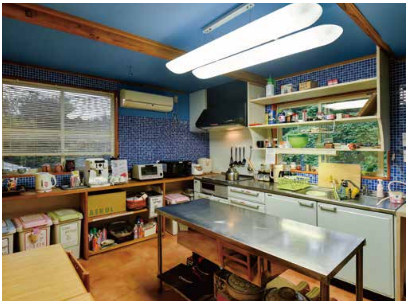
青色を基調とした1階のキッチン。中央に作業台があり、家族や仲間と一緒に楽しく料理ができる。